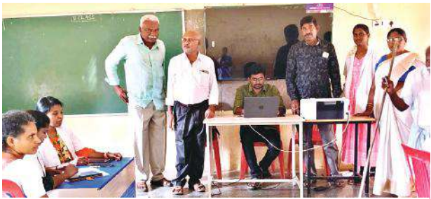
పరీక్షలు చేస్తున్న వైద్యాధికారులు