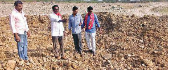
అక్రమ గ్రావెల్ తరలిస్తున్న ప్రాంతాలను పరిశీలిస్తున్న సిపిఎం నాయకులు