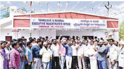
తహసీల్దార్ కార్యాలయం వద్ద నిరసన వ్యక్తం చేసిన ప్రజలు.

అయితే చెన్నూరు నుండి ఇన్ని గ్రామాలకు వెళ్లే దగ్గర యాటర్స్ లేకపోతే ఎలా అని ప్రశ్నించారు. అన్ని గ్రామాల దగ్గర ఎలాగైతే యాటర్స్ ఉంటే మా గ్రామంలోకి వచ్చే దారి కూడా ఇలాగే చేయాలని వారు డిమాండ్ చేశారు. మండలానికి ఎవరైనా అధికారులు కొత్తగా వచ్చిన ప్రతిసారి ఈ సమస్య పునరావృతం అవుతుందన్నారు. భవిష్యత్తులో మా ఈ సమస్య పునరావృతం కాకుండా అధికారులు, ప్రజాప్రతి నిధులు అందరూ కలిసి ఉన్నత అధికారుల దృష్టికి తీసుకెళ్లి శాశ్వత పరిష్కారాన్ని చూపాలని ఈ సందర్భంగా కోరారు. ఈ కార్యక్రమంలో మైన్ద్రాట్ నాయకులు, ప్రజా ప్రతి నిధులు, ప్రజా సంఘాల నాయకులు, ఆటో డ్రైవర్లు, చెన్నూరు ప్రజలు పెద్ద ఎత్తున పాల్గొన్నారు.