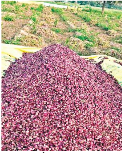
పొలంలో నిల్వ ఉన్న ఉల్లిగడ్డలు

సిండికేట్ అయిన వ్యాపారస్తులు - 4వేల నుంచి 15 వందలకు - ఆందోళనలో రైతులు