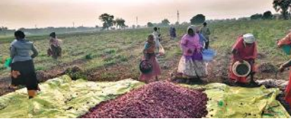
కె.పి. ఉల్లిగడ్డలు కోస్తున్న కూలీలు

కానీ కేంద్ర, రాష్ట్ర ప్రభుత్వాలు పట్టించుకున్న పాపాన పోలేదు. గతంలో కొన్ని దపాలు మార్కెట్ ఏర్పాటు చేశారు. అయితే గత రెండు రోజుల క్రితం రేటు ఎక్కువ ఉండడంతో రైతులు కూడా మార్కెట్ యార్డ్ కావాలని దృష్టి పెట్టలేదు, రైతులు కూడా మార్కెట్ కావాలని డిమాండ్ చేయలేదు. అయితే వ్యాపారస్తులంతా సిండికేట్ గా ఏర్పడి ఒకేసారి రేటు తగ్గించడంతో రైతులు ఆందోళన చెందుతున్నారు. దువ్వూరు మండలంలోని నీలాపురం, దాసరి పల్లె, బాలయపల్లె, మదిరేపల్లె, చిన్న సింగం పల్లె, మూడిండ్ల పల్లె, తదితర గ్రామాలలో ఇంకా రైతుల పొలాల్లో పంట ఉంది. అలాగే ప్రస్తుతము 1500 నుంచి 2000 వరకు కొనుగోలు చేస్తున్నట్లు రైతులు చెబుతున్నారు. ఏది ఏమైనా కృష్ణాపురం ఉల్లిగడ్డలు రైతులను కొద్ది రోజులు నవ్వుతూ, మరికొద్ది రోజులు ఏడిపిస్తూ ధరలు ఉంటాయని రైతులు చెబుతున్నారు. ఇప్పటికైనా ప్రభుత్వం దృష్టి ఉంచి కేపీ ఉల్లిగడ్డలకు మార్కెట్ ద్వారా గాని నా ద్వారా గాని 100 కేజీలు 5 వేల రూపాయలతో కొనుగోలు చేయాలని రైతులు కోరుతున్నారు.