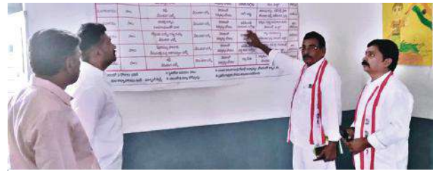
బీసీ గురుకుల హాస్టల్లో మెసా పరిశీలిస్తున్న దృశ్యం