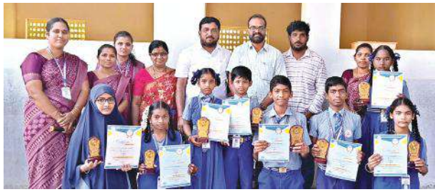
విద్యార్థులను అభినందిస్తున్న ఉపాధ్యాయులు