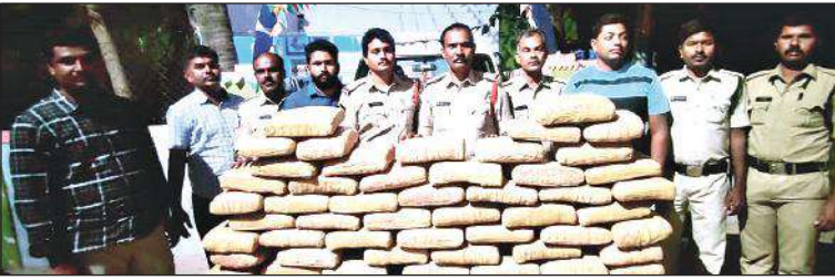
గంజాయిని స్వాధీనం చేసుకున్న పోలీసులు

- రెండు కార్లు, 100 కేజీలు గంజాయి స్వాధీనం..