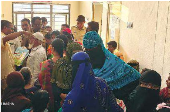
, పనిచేయకపోవడంతో తామేమి చేయలేకపోతున్నామన్నారు. సమయం చాలా తక్కువగా ఉండడంతో ఆందోళన చెందుతున్న లబ్ధిదారులు. సర్పర్ సరిగ్గా పనిచేయటం సంబంధిత అధికారులు చర్యలు తీసుకోవలసిందిగా లబ్ధిదారులు అధికారులను వేడుకుంటున్నారు.

అన్నమయ్య బ్యారో, మేజర్ స్టూస్: అన్నమయ్య జిల్లా రాయచోటి మున్సిపాలిటీలో జగనన్న ఇంటి పట్టాల, రిజిస్ట్రేషన్ ప్రక్రియ రెండవ రోజు సర్పర్ సరిగ్గా పనిచేయకపోవడంతో రిజిస్ట్రేషన్ కోసం చంటి బిడ్డలతో వచ్చిన తల్లులు, వృద్ధులు, మున్సిపాలిటీ నందు జగనన్న ఏమి మాకు ఈ కప్పాలంటూ మహిళలు ఆవేదన వ్యక్తం చేశారు. గంటలకు తరబడి వేచి ఉన్న పనిచేయని సర్పర్లు, నియోజకవర్గ, పరిధిలోని అన్ని సచివాలయాల నుంచి లబ్ధిదారులు అధిక సంఖ్యలో రావడంతో ఉదయం నుంచి తిండి తిప్పలు లేక వేచి ఉండాల్సిన పరిస్థితి ఏర్పడింది అన్నారు. సర్పర్ మొరాయింపడంతో లబ్ధిదారులకు రిజిస్ట్రేషన్ ప్రక్రియ తలసాగిగా మారింది. ఈ విషయమై సంబంధిత అధికారులకు లబ్ధి దారులు వివరణ, కోరగా సర్పర్ సరిగ్గా