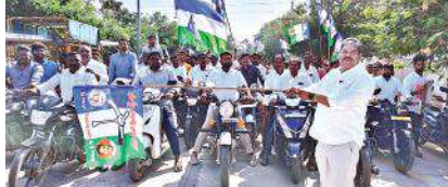
ద్విచక్ర వాహన ర్యాలీని జెండా ఊపి ప్రారంభిస్తున్న చైర్మన్

జాతరను తలపించిన యాత్ర 2 సినిమా - ద్విచక్ర వాహన ర్యాలీ నిర్వహించిన వైకాపా నాయకులు - జెండా ఊపి ప్రారంభించిన చైర్మన్