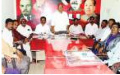
పార్టీ ప్రభుత్వం పెట్టుబడిదారులకు వంత పడుతోందని అన్నారు. పేద, బడుగు, బలహీన వర్గాలైన కార్మిక వర్గం నడ్డి విరిసే విధంగా ప్రధాని మోదీ పాలన ఉందని ఆయన ఆరోపించారు.