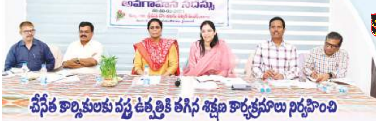
చేనేత కార్మికులకు వస్త్ర ఉత్పత్తికి తగిన శిక్షణ కార్యక్రమాలు నిర్వహించి