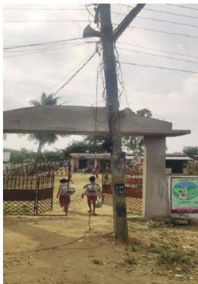
పెనుబల్లి సూర్య మేజర్ స్కూల్.....

మార్గమధ్యలో ప్రమాదకరంగా ఉన్న విద్యుత్ స్తంభాన్ని తొలగించాలని స్థానికల ప్రజలు విజ్ఞప్తిచేశారు. విద్యుత్ స్తంభం పాఠశాలకు వెళ్లే విద్యార్థులకు ప్రమాదకరంగా మారింది. విద్యుత్