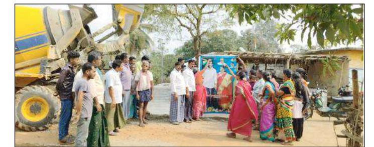
రామచంద్రపురంలో సిసి రోడ్ల నిర్మాణ పనులు