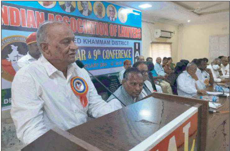
కుప్పకూలుతున్న ప్రజాస్వామిక వ్యవస్థలు

అలస్యమవుతున్న తీర్పులు కొత్త న్యాయస్థానాల ఏర్పాటు