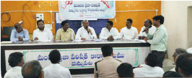
- ఎమ్మెల్యే జారే ఆదినారాయణ

దమ్మపేట, సూర్య (మేజర్ న్యూస్) - ప్రభుత్వం ప్రజల కోసం ప్రవేశపెట్టిన సంక్షేమ పథకాలను ప్రజలకు అందించడంలో అధికారులు ముందుండాలని అశ్వరావుపేట నియోజకవర్గ శాసనసభ్యులు జారే ఆదినారాయణ పేర్కొన్నారు. స్థానిక మండల పరిషత్ కార్యాలయంలో సోమవారం సర్వసభ్య సమావేశం ఎంపీపీ సోయం ప్రసాద్ అధ్యక్షతన నిర్వహించారు ఈ సందర్భంగా స్థానిక శాసనసభ్యులు జారే ఆదినారాయణ మండలంలో పనిచేస్తున్న పలు శాఖల అధికారుల పనితీరును అడిగి తెలుసుకున్నారు ఇప్పటివరకు జరిగిన అభివృద్ధి కార్యక్రమాలను అధికారులు వివరించారు ఈ క్రమంలోనే మండలంలో పనిచేస్తున్న వైద్యాధికారులు శాఖపరమైన కార్యక్రమాలను వివరిస్తుండగా ఎమ్మెల్యే జారే ఆదినారాయణ