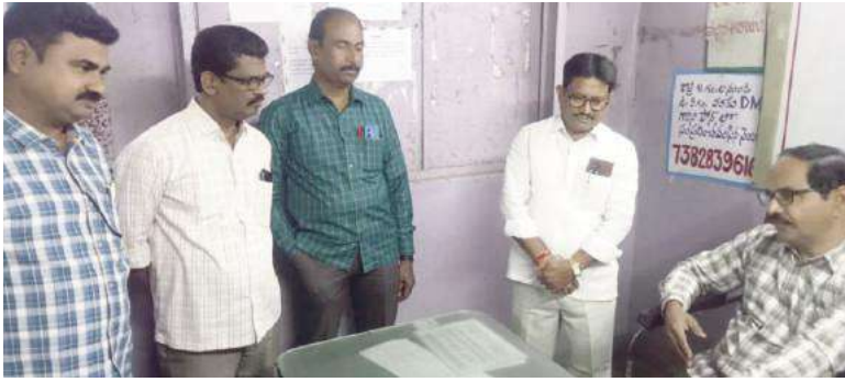
- కార్మికులను కలుసుకుందాం- వారి సమస్యలను తెలుసుకుందాం - కొత్తగూడెం డిపోలో ఎన్డబ్ల్యుఎఫ్