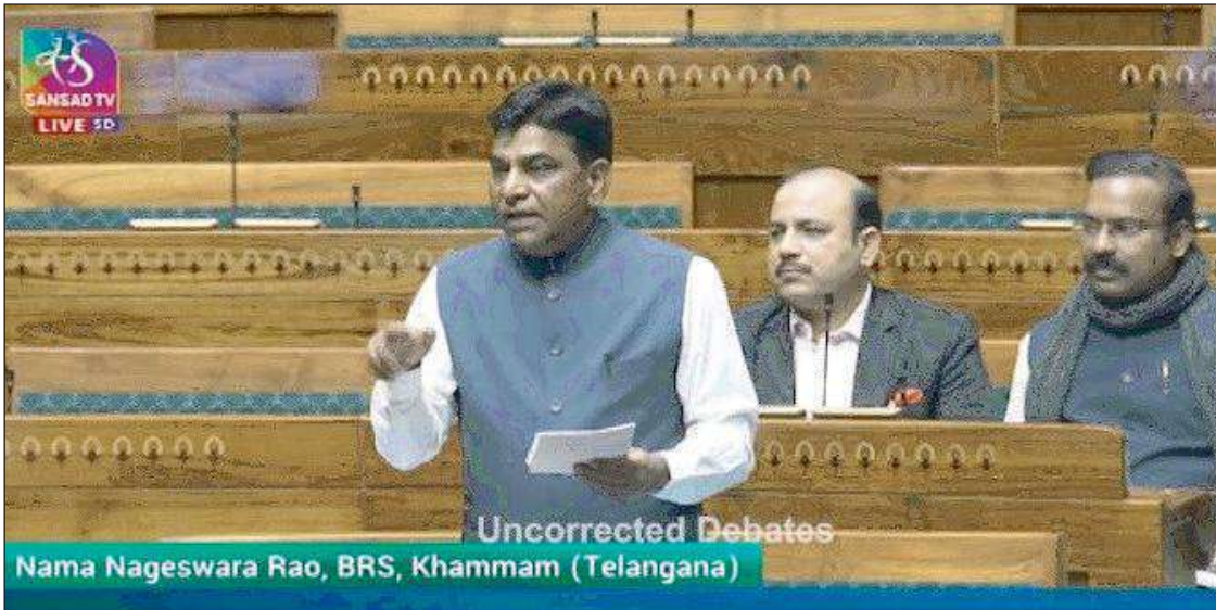
రైతులను నిరాశపర్చిన కేంద్ర బడ్జెట్