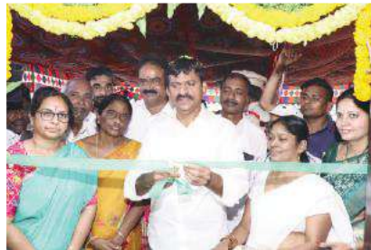
ఖమ్మం సూర్య బ్యూరో :