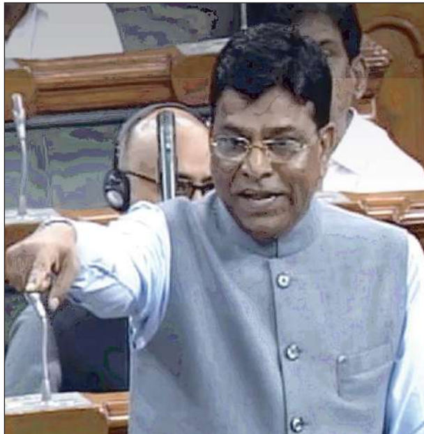
ప్రశ్నించారు. సారవంతమైన వ్యవసాయ భూములను కాపాడుకునేందుకు అనేక గ్రామాల రైతులు అలైన్మెంట్ మార్చాలని డిమాండ్ చేస్తున్నారు