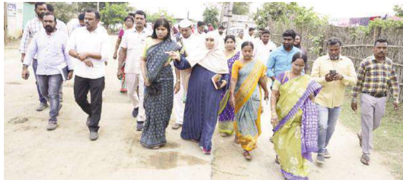
సూచించారు. గ్రామాల పరిశుభ్రతకు రాష్ట్ర ప్రభుత్వం ఈ నెల 15వ తేదీ వరకు ప్రతి రోజు ఒక పాల్గొన్నారు.