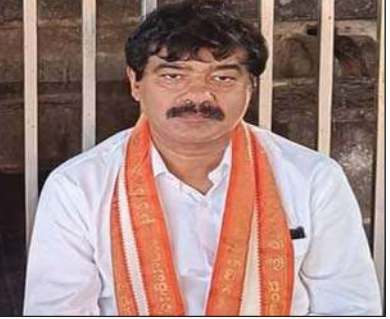
తెనాలి, మేజర్ న్యూస్: మాజీ మంత్రి కన్నా లక్ష్మి నారాయణపై పల్లారు జిల్లా ముప్పాళ్ల మండలం,