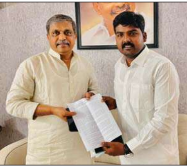
కొల్లిపర, మేజర్ న్యూస్: ఆంధ్రప్రదేశ్ రాష్ట్ర సమాచార కమిషనర్ గా చావలి సునీల్ ని నియమిస్తూ రాష్ట్ర ప్రభుత్వం ఉత్తర్వులు జారీ చేసింది. ఈయన తెనాలి నియోజకవర్గంలోని కొల్లిపర గ్రామంలో