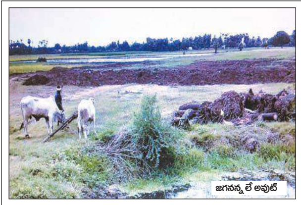
జగన్నన్న లే అవుట్