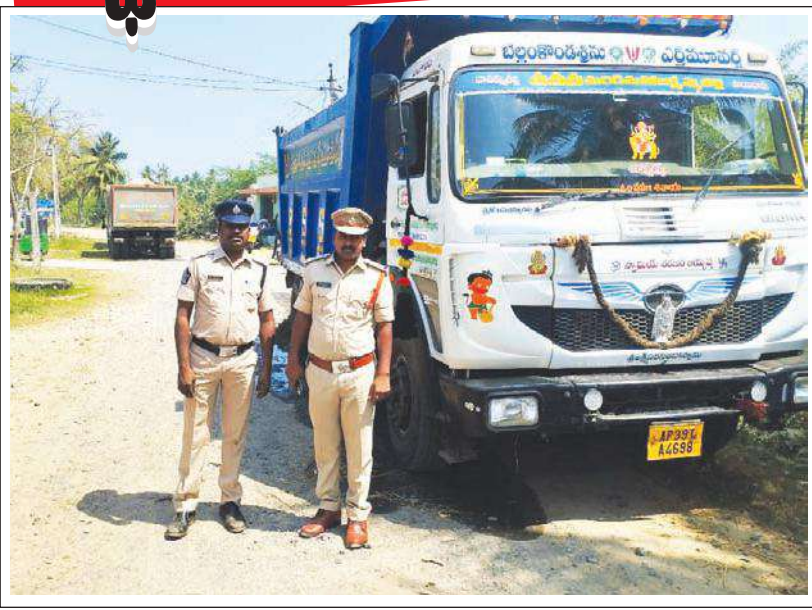
కృత్రిమంగా ఫిబ్రవరి 27 మేజర్ స్వాస్ : మండల పరిధిలో అక్రమ ఇసుక తవ్వకాల ఆగడాలు రోజురోజుకూ పెచ్చుమీరుతున్నాయి. రెండు వైపుల ఉప్పుటేరు, మరో రెండు వైపులా సముద్రం నడిమి గ్రామం ఇది చిన్న