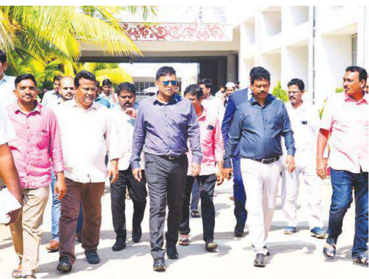
ఎన్టీఆర్ జిల్లా బ్యూరో, ఫిబ్రవరి 27, మేజర్ స్వాస్ : త్వరలో జరగనున్న సాధారణ ఎన్నికలను అత్యంత పారదర్శకంగా, జవాబుదారీతనంతో నిష్పక్షపాతంగా

కనీసం మార్గదర్శకాలకు అనుగుణంగా కౌంటింగ్ కేంద్రాల్లో ఏర్పాట్లు లోటుపాట్లకు తావులేకుండా మౌలిక వసతుల కల్పన సాయుధ దళాలతో నిరంతర నిఘా, ప్రత్యేక భద్రతా ఏర్పాట్లు జిల్లా కలెక్టర్ ఎస్.డిల్లీరావు