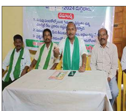
దుగ్గిరాల, మేజర్ న్యూస్ : దుగ్గిరాల రైలు పేటలోని శుభం మహేశ్వరి కోల్డ్ స్టోరేజ్ లో జరిగిన అగ్నిప్రమాదంలో నష్టపోయిన పసుపు రైతుల రిలే