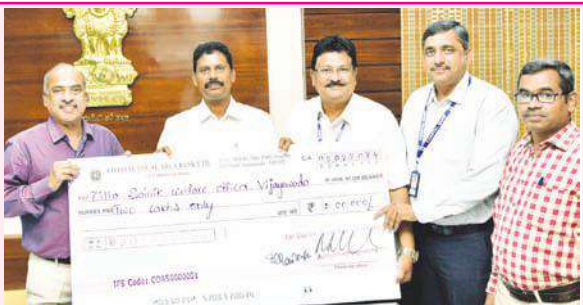
సాయుధ దళాల పతాక దినోత్సవ నిధికి