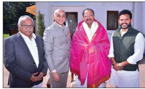
ఉన్నా ఎందరికో స్ఫూర్తిగా, ఆదర్శం గా నిలిచారు. దృఢ సంకల్పం, తిరుగులేని క్రమశిక్షణతో విజయపథం వైపు బాటలు వేశారు, విద్యార్థి దశ

గుంటూరు జిల్లా నేటి దినపత్రిక సూర్య బ్యూరో : పద్మవిభూషణ్ అవార్డు గ్రహీత వెంకయ్య నాయుడుకి తెదేపా పార్లమెంటరీ పార్టీ నాయకుడు గుంటూరు ఎంపీ గల్లా జయదేవ్ బుధవారం శుభాకాంక్షలు తెలిపారు. బుధవారం మాజీ ఉపరాష్ట్రపతి వెంకయ్య నాయుడు నివాసంలో తెదేపా ఎంపీలు శుభాకాంక్షలు తెలియచేసారు. ఎంపీలు రామ్మోహన్ నాయుడు, కనకమేడల రవీంద్ర కుమార్ పాల్గొన్నారు. దేశ రాజకీయాలే సుదీర్ఘకాలంపాటు అందించిన సేవలకు గుర్తింపుగా పద్మవిభూషణ్ అవార్డును ప్రకటించటం సంతోషం కలిగించింది. సుదీర్ఘకాలం ప్రజా జీవితంలోనే