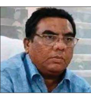
క్లీనింగ్ నందు పనిచేయుచున్న స్త్రీ పురుషులు రాష్ట్ర ప్రభుత్వ ఉత్తర్వులు మేరకు సంబంధిత వివరాలు ఆయా వార్డుల పరిధిలో గల సచివాలయాల యందు శానిటేషన్ సెక్రటరీల వద్ద నమోదు చేయించుకోవాలని పొన్నూరు పురపాలక సంఘ కమిషనర్ నయ్యామ్ అహ్మద్ ఒక ప్రకటనలో భాగంగా తెలిపారు. దీనికి సంబంధించి ఆధార్ కార్డు, రేషన్ కార్డు, ఏదైనా సంస్థలో పనిచేస్తున్న గుర్తింపు కార్డు, కుటుంబ వివరాలు, వారి యొక్క ఆదాయ వివరాలు( జీతభత్యాల నకళ్ళు ) అందచేయాలని ఆయన సూచించారు.

పొన్నూరు మేజర్ న్యూస్ : సెప్టిక్ ట్యాంక్ క్లీనింగ్ చేసే స్త్రీ, పురుషులు తమ యొక్క వివరాలు మీ సచివాలయం పరిధిలో అందచేయాల అని మున్సిపల్ కమిషనర్ నయ్యామ్ అహ్మద్ తెలిపారు. పొన్నూరు పురపాలక సంఘ పరిధిలో సీవరేజ్ డ్రైనేజీస్ మరియు డి సెప్టింగ్ ఆపరేషన్ మిషన్ ద్వారా సెప్టిక్ ట్యాంక్ క్లీనింగ్ నందు పనిచేయుచున్న స్త్రీ పురుషులు రాష్ట్ర ప్రభుత్వ ఉత్తర్వులు మేరకు సంబంధిత వివరాలు ఆయా వార్డుల పరిధిలో గల సచివాలయాల యందు శానిటేషన్ సెక్రటరీల వద్ద నమోదు చేయించుకోవాలని పొన్నూరు పురపాలక సంఘ కమిషనర్ నయ్యామ్ అహ్మద్ ఒక ప్రకటనలో భాగంగా తెలిపారు. దీనికి సంబంధించి ఆధార్ కార్డు, రేషన్ కార్డు, ఏదైనా సంస్థలో పనిచేస్తున్న గుర్తింపు కార్డు, కుటుంబ వివరాలు, వారి యొక్క ఆదాయ వివరాలు( జీతభత్యాల నకళ్ళు ) అందచేయాలని ఆయన సూచించారు.