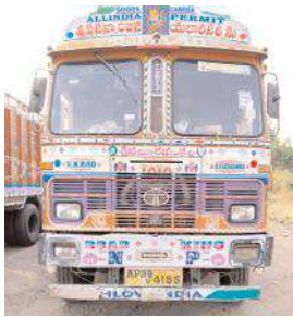
సీక్ చేసిన లారీ