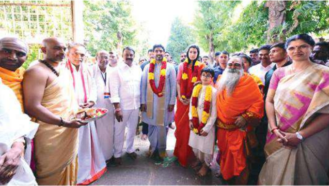
శ్రీశైలం, మేజర్ న్యూస్: