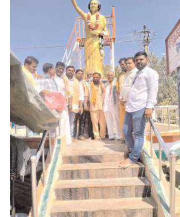
ఇందిరాగాంధీ విగ్రహానికి నివాళులర్పిస్తున్న కాంగ్రెస్ నాయకులు