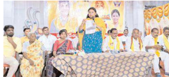
మాట్లాడుతున్న భూమా అఖిలప్రియ

చాగలమర్రి,మేజర్ న్యూస్ : బీసీల ప్రగతి తెలుగుదేశం పార్టీతోనే సాధ్యమవుతుందని మాజీమంత్రి అఖిలప్రియ అన్నారు. గురువారం చాగలమర్రిలోనికన్యకాపరమేశ్వరికళ్యాణమండపంలో జయహోమా బీసీ కార్యక్రమాన్ని నిర్వహించారు. ఈ కార్యక్రమానికి ముఖ్యఅతిథిగా హాజరైన మాజీ మంత్రి అఖిలప్రియ మాట్లాడుతూ దేశంలోనే మొదటిసారిగా బీసీలకు రక్షణ చట్టం తెచ్చి వారికి తెలుగుదేశం పార్టీ అండగా నిలుస్తుందన్నారు. బీసీల కోసం తెలుగుదేశం పార్టీ ప్రవేశపెట్టిన 30కు పైగా పథకాలను ఈ ప్రభుత్వం రద్దు చేసిందని ఆమె విమర్శించారు. స్కాలర్షిప్ ఎన్టీఆర్ విదేశీ విద్య ఆదరణ బీసీ కార్పొరేషన్ చంద్రన్న పెళ్లి కాసుక చంద్రన్న బీమా తల్లి బిడ్డ ఎక్స్ ప్రెస్ లాంటి ఎన్నో పథకాలను జగన్ మోహన్ రెడ్డి రద్దు చేశారని అన్నారు. 75 మందికి పైగా బీసీ నాయకులు ఈ ప్రభుత్వ అక్రమాలను ఎదిరించినందుకు హత్య చేయబడ్డారని మరి ఎంతోమంది దాడులకు గురయ్యారని ఆరోపించారు. బీసీల అభ్యుత్థి కోసం అప్పటి ముఖ్యమంత్రి ఎన్టీ రామారావు, ఇప్పటి చంద్రబాబు నాయుడులు ఎంతో కృషి చేశారన్నారు. ఒక్క అవకాశం అని అధికారంలోకి వచ్చిన జగన్మోహన్ రెడ్డి బీసీలకు తీరని అన్యాయం చేశారని