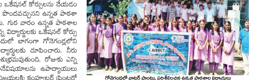
గోనెగండ్లలో వాటర్ ప్లాంట్ పరిశీలించిన ఉన్నత పాఠశాల విద్యార్థులు