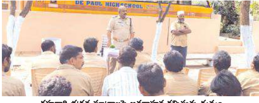
రహదారి భద్రత సూత్రాలపై అవగాహన కల్పిస్తున్న దృశ్యం