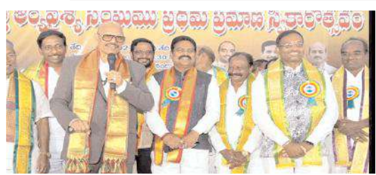
మాట్లాడుతున్న టిజి వెంకటేష్

ఆర్యవైశ్యులు రాజకీయాల్లో రాజీంచాలన్నారు. బిసి, ఎస్సీ, ఎస్టీలకు కేంద్ర, రాష్ట్ర ప్రభుత్వాలు సహకారాలు అందించాయన్నారు. ఆర్యవైశ్యులు ఓసీలని చెప్పి రాజ్యాంగ పరంగా హక్కులను కల్పించలేదన్నారు. పేద ఆర్యవైశ్యులను ఆడుకునేందుకు ఆర్యవైశ్య సంఘాలకు మంచి అవకాశ మన్నారు. ఆర్యవైశ్యులు అన్ని పార్టీలలో ఉండాలని, వారి స్థాయిని