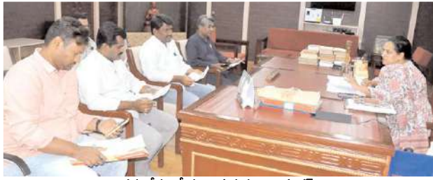
సమావేశంలో మాట్లాడుతున్న జిల్లా కలెక్టర్

కర్నూలు, మేజర్ న్యూస్ ప్రతినిధి: ఓటు కోసం ఇప్పుడు కూడా అర్హులు ఎవరైనా ఉంటే దరఖాస్తు చేసుకోవచ్చని జిల్లా