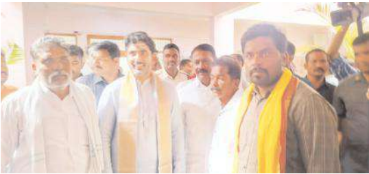
నారా లోకేష్ ను కలిసిన లింగాలగట్టు టిడిపి నాయకులు

-కృష్ణానదిలో టన్నుల కొద్ది మృతి చెందిన చేపల వల్ల సప్లయపొందిన మత్స్యకార కుటుంబాలను ఆదుకోవాలని వినతి