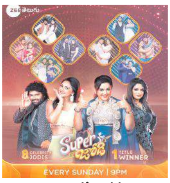
సూపర్ జోడి షో లోగో