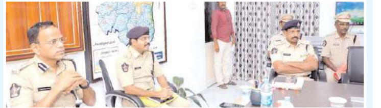
హాజరైన డిఐజీ, రాయలసీమ ఎస్పీలు