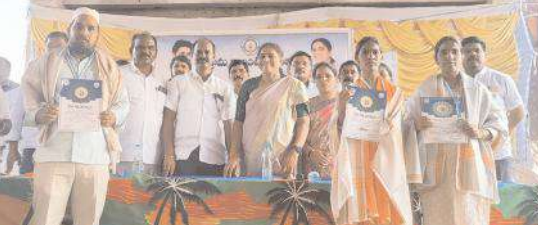
సేవ అవార్డులు అందుకుంటున్న ఉత్తమ వాలంటీర్లు

వెల్చుర్ల రూరల్ మేజర్ న్యూస్ : రాష్ట్రంలో వైఎస్ఆర్పి ప్రభుత్వం అధికారం చేపట్టి 55 నెలలు పూర్తయి ప్రజలకు మరింత మెరుగైన సేవలు అందించాలన్న ఉద్దేశంతో స్థానికంగా తమ నివాస ప్రాంత ప్రజలకు అందుబాటులో ఉండే విధంగా రాష్ట్ర ముఖ్యమంత్రి శ్రీ వైఎస్ జగన్మోహన్ రెడ్డి ప్రభుత్వం దేశంలో ఎక్కడా లేనివిధంగా సచివాలయ వ్యవస్థను ఏర్పాటు చేయడం జరిగిందని పత్రికాంధ నియోజకవర్గం ఎమ్మెల్యే కంగాణ్ శ్రీదేవి అన్నారు. గురువారం మండల కేంద్రమైన వెల్చుర్ల పట్టణంలోని మండల ప్రజాపరిషత్ కార్యాలయం నందు ఎంపీటివో శివ శంకరపు అధ్యక్షతన ఉత్తమ సేవలను అందించిన వాలంటీర్లకు సేవా మిత్ర, సేవారత్న, సేవా వజ్రా పురస్కారాలను ఎమ్మెల్యే శ్రీదేవి అందజేశారు. ఈ సందర్భంగా ఎమ్మెల్యే శ్రీదేవి మాట్లాడుతూ రాష్ట్ర ముఖ్యమంత్రి శ్రీ వైఎస్ జగన్మోహన్ రెడ్డి వాళ్ళింటికి వ్యవస్థను ప్రవేశపెట్టి గ్రామాలలోని ప్రజలకు అండగా నిలిచారని ప్రతి సంక్షేమ పథకాన్ని అర్జులైన లబ్ధిదారులకు నేరుగా వాలంటీర్ ద్వారా ఇంటి వద్దకే చేరవేయడం వాలంటీర్ వ్యవస్థ కీలకపాత్ర పోషిస్తున్నారని తెలిపారు. 2019 ఎన్నికల మేనిఫెస్టోలో ఇచ్చిన హామీలను 99 శాతం అమలు చేసిన ఘనత సీఎం వైఎస్ జగన్మోహన్ రెడ్డికి దక్కుతుందని కొనియాడా