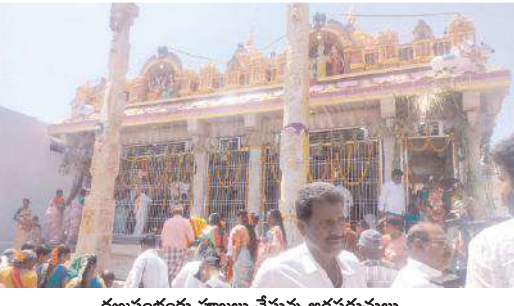
ధ్వజస్థంభంకు పూజలు చేస్తున్న ఆడపడుచులు

నందవరం, మేజర్ న్యూస్ (ఎమ్మిగనూరు ప్రతినిధి) : నందవరం మండలం ముగతి గ్రామంలో సూతనంగా నిర్మించిన అలయాల్లో శ్రీ రామలింగేశ్వర స్వామి, సీతా సమేత శ్రీరామచంద్రుని విగ్రహాలతో పాటు నవగ్రహాల ప్రతిష్ఠాపన తో పాటు అలయాల ముందు ధ్వజస్థంభ ప్రతిష్ఠ కార్యక్రమాలతో గ్రామం అంతా పండుగ