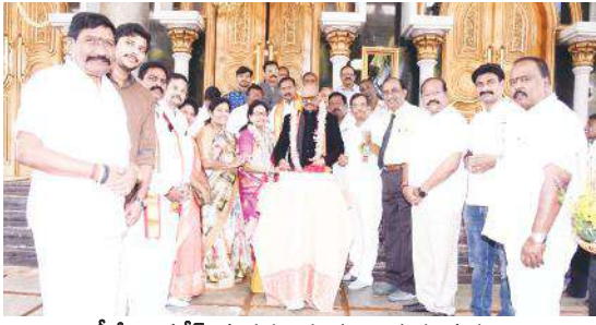
టీజీ వెంకటేష్ దంపతులను సన్మానిస్తున్న దృశ్యం

- ఆర్యవైశ్యులకు ఎలాంటి సమస్య వచ్చినా ఆదుకుంటాం - మాజీ రాజ్యసభ సభ్యులు టీజీ వెంకటేష్