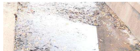
గ్రామంలో నిలిచిన మురుగు

మురుగు పేరుకుపోవడంతో అధికారులు ఏ మాత్రం చర్యలు తీసుకోవడంలేదని ఆవేధనను వ్యక్తం చేశారు.