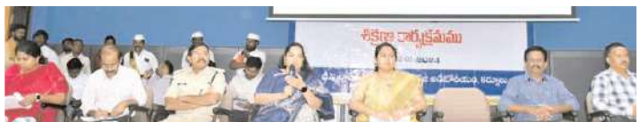
మాట్లాడుతున్న జిల్లా కలెక్టర్