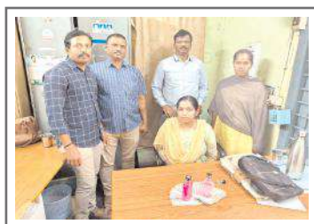
ఎసిబి వలలో మహేశ్వరి