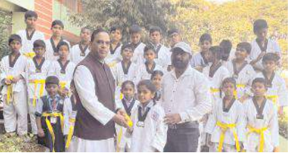
బెల్టులు అందజేస్తున్న దృశ్యం