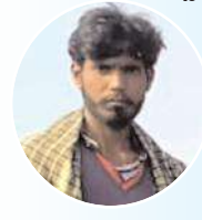
కబల్, రైతు, గోనెగండ్ల

సాగు చేసిన పంటలు ఎండిపోతున్నాయి. కబల్, రైతు, గోనెగండ్ల : బోర్ల కింద పంటలు చెవులకాయి. కార్ల, మొక్కజొన్న పంటలు సాగు చేశాము. బోర్లు, బావుల్లో నీరు అడుగంటి పోయింది. సాగు చేసిన పంటలు చేతికి అందే సమయంలో నీరు లేకపోవడంతో పంటలు ఎండిపోవడంతో పెట్టిన పెట్టుబడి చేతికందే విధంగా లేదని ఏమి చేయాలో తెలియని దిక్కు తోచని పరిస్థితుల్లో ఉన్నామని రైతు ఆవేదన వ్యక్తం చేశాడు.