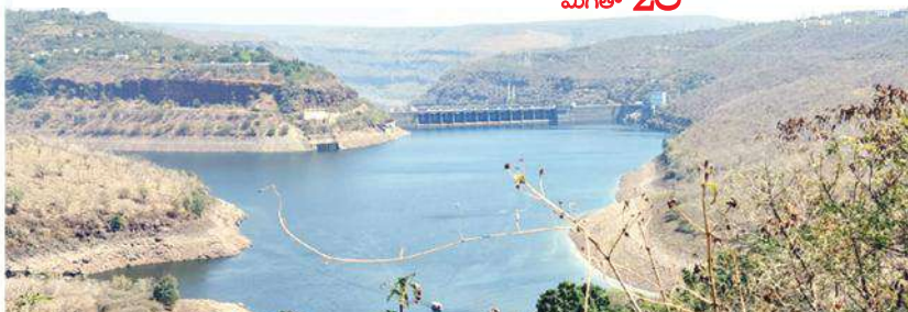
శ్రీశైలం డ్యాం వెనుక భాగాన నీటి నిల్వల దృశ్యం