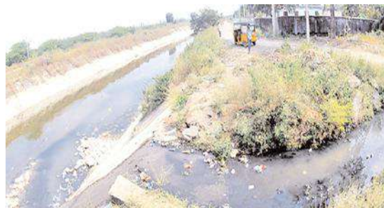
నిల్వ నిలిచిన మురికినీరు

కల్లూరు, మేజర్ న్యూస్: కల్లూరు అర్బన్ పరిధిలో దోమల వ్యాప్తి విపరీతంగా పెరిగిపోయింది. దీంతో ప్రజలు రోగాల బారిన పడుతున్నారు. దోమలు వ్యాప్తి పెరుగుతున్న మున్సిపల్ అధికారులు మాత్రం తమకేమీ పట్టనట్లు వ్యవహరిస్తున్నారన్న విమర్శలు వ్యక్తమవుతున్నాయి. గత 25 రోజుల నుంచి కల్లూరు పరిధిలో దోమలు వ్యాప్తి అధికంగా పెరిగింది. మురికి కాలువలను శుభ్రం చేయకపోవడం, ఫాగింగ్ చేయకపోవడంతో దోమల వ్యాప్తి పెరిగింది. అయినా మున్సిపల్ అధికారులు తమకేమీ పట్టనట్లు వ్యవహరిస్తున్నారని తెలుస్తోంది. మురికినీరు రోడ్లపైనే నిల్వ నిలుస్తుండటంతో దోమలు వ్యాప్తి పెరుగుతుందని ప్రజలు