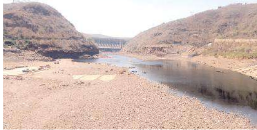
లింగాలగట్టు వద్ద లోలెవల్ హైలెవల్ పుష్కర ఘాట్ల పరిస్థితి

నాయకులు భావిస్తూ భక్తులకు ఎలాంటి ఇబ్బందులు తలెత్తకుండా దేవస్థానం అన్ని ముందస్తు ప్రత్యామ్నాయ చర్యలు పాటించాలని వారు కోరుతున్నారు. అలాగే శ్రీశైలం దేవస్థానం పరిధిలో వివిధ వసతి గృహాలతోపాటు ఆయా కులాలకు చెందిన నిత్య అన్నదాన సత్రాలు అధికంగా ఉన్నాయి. వీటన్నిటి ధృష్ట్యా బ్రహ్మోత్సవాల్లో త్రాగునీటి సమస్య తలెత్తకుండా నిరంతరం నీటి సౌకర్యాల అవసరం ఎంతైనా ఉంది. జలాశయంలో నీటి నిల్వ 37 టీఎంసీలు 817.70 అడుగులు, నీటి నిల్వ 37.8085 టీఎంసీలుగా సమాధాని. నీటిమట్టం తక్కువగా ఉండటంతో శ్రీశైలంలో పాతాళగంగ వద్ద మరింత అప్రమత్తంగా