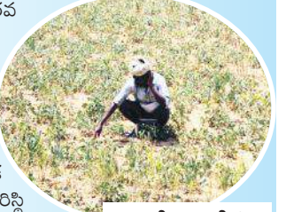
బావుల కింద ఎండి పంటలు

సకాలంలో పెద్దవర్షాలు కురవక పోవడం, దీనికి తోడు రైతులు అనాలోచితంగా ఎక్కడపడితే అక్కడ బోర్లు వేయటం వల్ల భూగర్భజలాలు అడుగంటిపోతున్నాయి. ఎమ్మిగనూరు నియోజకవర్గంలోనే బావులు, బోర్ల పరిస్థితి ఇంత దారుణంగా ఉంటే ఇక జిల్లాలో పరిస్థితి ఎంత దారుణంగా ఉందో అర్థం చేసుకోవచ్చు. ఎది ఏమైన వర్షాలు సంవృద్ధిగా కురియకపోవడం బావులు, బోర్లు ఎండి రైతుల పరిస్థితి ఇబ్బందికరంగా మారింది. గోనెగండ్ల, కులుమాల, ఎర్రబాడు, అలువాల, అగ్రహారం, గంజహళ్లి, బైలువుల, పెద్దమరివీడు, చిన్నమరివీడు, పెద్దనేలటూరు, చిన్ననేలటూరు హెచ్.కైరవాడి పిల్లి గుండ్ల, గ్రామాలతో పాటు పలు గ్రామాల్లో బోర్లు, బావులు అడుగంటి పోతున్నాయి.