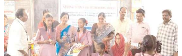
బహుమతులు అందజేస్తున్న దృశ్యం