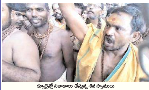
క్యాట్రెన్లో నివాదాలు చేస్తున్న శివ స్వాములు