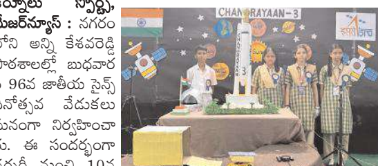
సమానాలు ప్రదర్శిస్తున్న విద్యార్థులు