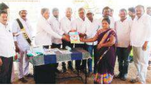
ఇళ్ల పట్టాలు పంపిణీ చేస్తున్న డిప్యూటీ ఎమ్మార్వో