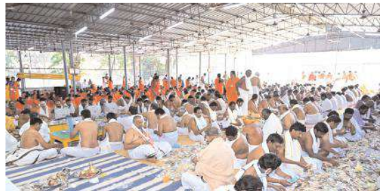
హుండ్డి లెక్కింపు చేస్తున్న దృశ్యం