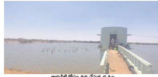
త్రాగునీటి కోసం శుద్ధి చేస్తున్న డ్యూప్లెక్స్

చాగలమల, మేజర్ న్యూస్ : వేసవికాలం ఆరంభంలోనే త్రాగునీటి కోసం ఇక్కడ మొదలయ్యాయి. ఈ ఏడాదివరకూ సక్రమంగా కురవ కపోవడంతో భూగర్భ జలాలు అడుగంటి ఉన్న నీటి వనరులు సైతం ఇంకాపోవడంతో బోర్లలోనీరు రాక ఇబ్బందులు గురవుతున్నాయి. ఇందుకోసం అప్పటి కాంగ్రెస్ ప్రభుత్వం ప్రధానమంత్రి పీఠీ నరసింహారావు మలివేముల సమీపంలోని సమ్మర్ స్టోర్ ట్యాంకును నిర్మించారు. గతనాలుగు సంవత్సరాలలో వర్షాలు సకాలంలో కురిసి భూగర్భాలు నీరు అధికంగా ఉండడంతో రాకుండా సంబంధిత అధికారులు చూశారు. ఈ ఏడాది వర్షాలు అడపాదడపా పడడంతో భూగర్భంలో నీ జలాలు పూర్తిగా అడుగంటి పోవడంతో సాగునీటి కోసం, త్రాగునీటి కోసం ఎద్దడి ఏర్పడింది. ప్రభుత్వం నీటి ఎద్దడి నివారించేందుకు మండలంలోని మల్లె వేముల సమీపంలో ఉన్న సమ్మర్ స్టోరేజ్ ట్యాంకు నీటిని శుద్ధి చేసి మండలంలోని చెట్టివీడు గొడిగనూరు, చాగలమల గ్రామాలకు సరఫరా చేస్తుంది. రక్షిత త్రాగునీటిసరఫరా అధికారులు, కాంట్రాక్టర్ కు నిధులు మంజూరు