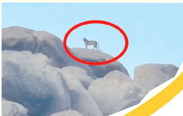
కోసిగి కొండపై చిరుత పులులు

ఎక్కడినుంచో వచ్చాయో.. తెలియదుగాని కోసిగిలోని తిమ్మప్పకొండను, కోసిగి గ్రామాన్ని వదిలివెళ్ళే ప్రసక్తేలేదంటూ.. ఈవిధంగా చిరుత పులులు ప్రతిరోజు కనిపిస్తూ హల్ చల్ చేస్తున్నాయి. రెండురోజుల క్రితం మేకలు, గొర్రెలపై దాడులుచేసి ప్రజలకు భయభ్రాంతులకు గురిచేశాయి. కోసిగి కొండపై మూడురోజులపాటు తిరుగుతూ కోతులపై దాడులు చేస్తూ హల్ చల్ చేస్తూనే ఉన్నాయి. ప్రతిరోజు చిరుత పులులు గ్రామంలో కొండలపై కనిపిస్తూ ఉండడంతో ప్రజలకు మామూలే ప్రతిరోజు కనిపిస్తూనే ఉన్నాయి. వాటిని పట్టుకునేవారు లేకపోవడంవల్లే వాటిపని అవిచేస్తున్నాయంటూ ప్రజలు చర్చించుకుంటున్నారు. అయితే ఫారెస్ట్ అధికారులు మాత్రం సిసికెమెరాలు ఏర్పాటుచేసి మాపని అయిపోయిందంటూ ఇప్పటివరకు కనిపించుకుండా వెళ్ళిపోయారని గ్రామస్థులు ఆరోపిస్తున్నారు.