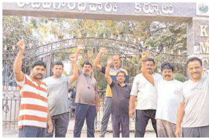
నిరసన తెలుపుతున్న కాలనీవాసులు

కర్నూలు, మేజర్‌న్యూస్ ప్రతినిధి: నగరంలోని వెంకటరమణ కాలనీలో ఉన్న రాజీవ్‌గాంధీ పార్కును అభివృద్ధి చేయాలని కాలనీ వాసులు కోరారు. సోమవారం పార్కు ఎదుట కాలనీవాసులు నిరసన తెలిపారు. పార్కు అభివృద్ధికి నోచుకోకపోవడంతో అపరిశుభ్రంగా మారిందన్నారు. దీంతో పార్కుకు వచ్చే ప్రజలు అనారోగ్యానికి గురవుతున్నారన్నారు. తక్షణమే పార్కులో అభివృద్ధి పనులు