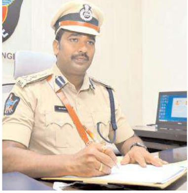
కర్నూలు రేంజ్ డివిజన్ బాధ్యతలు చేపడుతున్న దృశ్యం