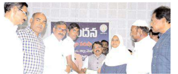
విద్యార్థిని ప్రశంసిస్తున్న జిల్లా కలెక్టర్