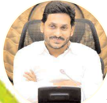
సీఎం జగన్మోహన్ రెడ్డి