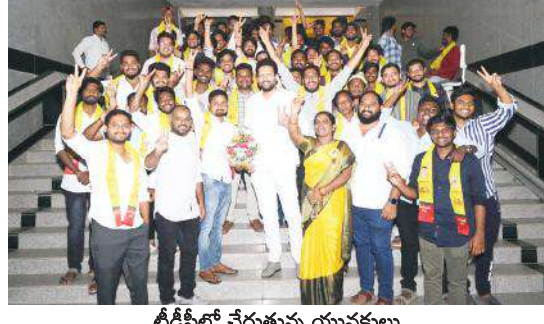
టీడీపీలో చేరుతున్న యువకులు