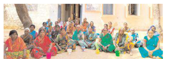
తహశీల్దార్ కార్యాలయం ఎదుట బైరాయింబి ఆందోళన చేస్తున్న మహిళలు