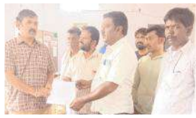
వినతిపత్రం అందజేస్తున్న దృశ్యం