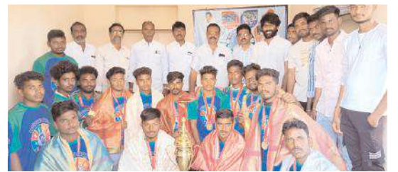
క్రీడాకారులను సత్కరించిన మండల వైకాపా నాయకులు