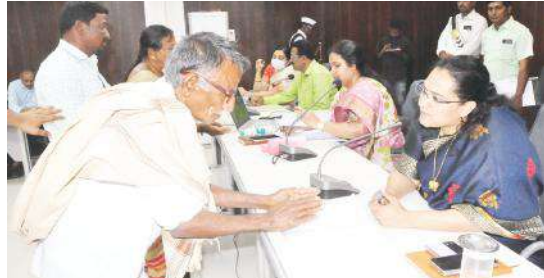
వినతులు స్వీకరిస్తున్న కలెక్టర్ జి.నృజన

కర్నూలు, మేజర్ న్యూస్ ప్రతినిధి : స్పందన అర్జీలను పరిష్కరించడంలో ఎటువంటి అలసత్వం వహించకూడదని జిల్లా కలెక్టర్ జి.నృజన అధికారులను ఆదేశించారు. సోమవారం కలెక్టరేట్ లోని కాన్ఫరెన్స్ హాల్ లో ప్రజా సమస్యల పరిష్కార వేదిక జగనన్నకు చెబుదాం-స్పందన కార్యక్రమంలో ప్రజల నుంచి వచ్చిన వినతులను కలెక్టర్ జి.నృజన జేసీ నారపురెడ్డి మార్కెట్ కలిసి అర్జీలను స్వీకరించారు. ఈ సందర్భంగా కలెక్టర్ మాట్లాడుతూ అర్జీదారుడు ఇచ్చిన వినతిని క్షుణ్ణంగా పరిశీలించి పరిష్కరించాలన్నారు. ఒకవేళ పరిష్కరించలేని అర్జీ అయితే అర్జీదారుడికి అర్థమయ్యే రీతిలో వివరించడంతోపాటు ఎందుకు పరిష్కరించలేమో అందుకు తగిన కారణాలను వారికి వివరించేలా అధికారులు చర్యలు తీసుకోవాలన్నారు. అనంతరం సాధారణ ఎన్నికల ప్రక్రియలో భాగంగా బదిలీపై వచ్చిన పలువురు తహసీల్దార్లు జిల్లా