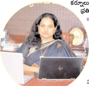
వీడియో కాన్ఫరెన్స్ లో మాట్లాడుతున్న కలెక్టర్

కర్నూలు, మేజర్ న్యూస్ ప్రతినిధి: జగన్మోహన్ రెడ్డి డివిజన్ డివిజన్ కల్పించాల్సిన మౌలిక సదుపాయాల పనులు త్వరగా పూర్తి చేసే విధంగా చర్యలు చేపట్టాలని రాష్ట్ర ప్రభుత్వ ప్రధాన కార్యదర్శి