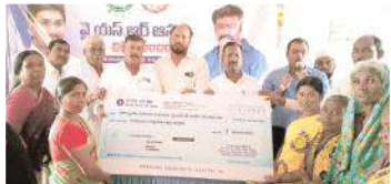
చెక్కు సమానాను అందిస్తున్న దృశ్యం