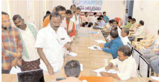
అర్జీలను స్వీకరిస్తున్న సబ్ కలెక్టర్ కార్యాలయ అధికారి