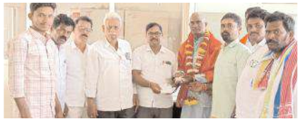
వెండి గట్టును అందజేస్తున్న భక్తులు