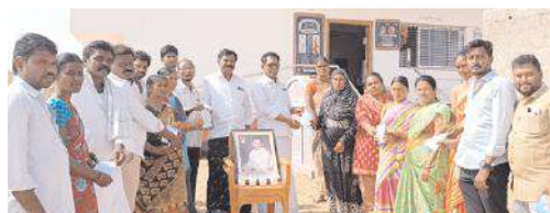
ఆర్థిక సాయం అందజేస్తున్న ధృష్టం

తుగ్గలి, మేజర్ న్యూస్: మండలంలోని గుత్తి ఎర్రగుడి సచివాలయంలో ఇటీవల ఏడుమంది మరణించడంతో వారి కుంబం సభ్యులకు సోమవారం వైఎస్సార్ బీమా కింద ఆర్థిక సహాయం