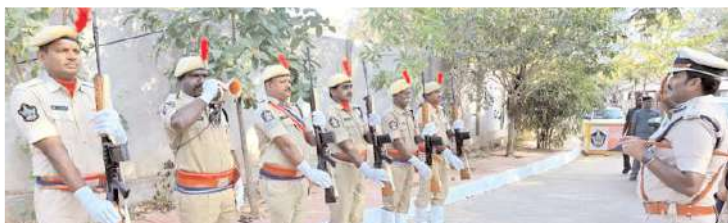
పోలీసుల గౌరవ వందనం స్వీకరిస్తున్న దృశ్యం