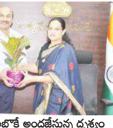
పూలబోకే అందజేస్తున్న దృశ్యం