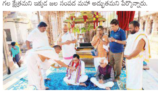
గల క్షేత్రమని ఇక్కడ జల సంపద మహా అద్భుతమని పేర్కొన్నారు.