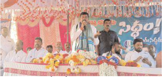
సమావేశంలో మాట్లాడుతున్న విరుపాక్షి

- మాకు భరోసా ఏదంటూ, వైసీపీ నాయకుల జిల్లా అధ్యక్షుడి వద్ద ఆవేదన