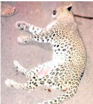
రోడ్డు ప్రమాదంలో మృతి చెందిన చిరుతపులి

అత్యుక్తారు, మేజర్ న్యూస్: అత్యుక్తారు-దోర్నాల రోడ్డులో జరిగిన ప్రమాదంతో చిరుతపులి మృతి చెందినట్లు అటవీ శాఖ అధికారులు తెలిపారు. అటవీ శాఖ అధికారుల వివరాల మేరకు మండల పరిధిలోని బైరట్లజి గూడేనికి సమీపంలో అత్యుక్తారు - దోర్నాల మధ్య రోడ్డు ప్రమాదం చోటు చేసుకుందని అన్నారు. ఆదివారం రాత్రి వేళ స్పీడుగా వెళ్తున్న వాహనం