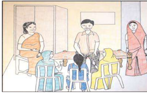
కొందరు పొదుపు మహిళలు జోక్యం చేసుకొని పెన్షన్లు,

మహిళలను ఉద్దేశించి మున్సిపల్ కీలక నాయకురాలు మాట్లాడుతూ వార్డులో అభివృద్ధి గురించి మాట్లాడే క్రమంలో గత మున్సిపల్ ఎన్నికల్లో బిర్యానీకి ఆశపడ్డారని వ్యాఖ్యానించారు. బిర్యానీలకు ఆశపడి ఇప్పుడు అభివృద్ధిని కోరితే ఎలా అంటూ సంభోదించారు. అధికార పార్టీని కాదని మరొకరిని గెలిపిస్తే పరిస్థితి ఇలాగే ఉంటుందన్నారు. అధికార పార్టీ అభ్యర్థులను కాకుండా ఇంకొకరిని గెలిపిస్తే సమస్యలు తీరవన్నారు. వార్డుల్లో అభివృద్ధిని కోరితే ఎలా జరుగుతుందని ప్రశ్నించారు. చివరకు అభివృద్ధిని ఆశించడం ఏమిటని ప్రశ్నల వర్షం కురిపించారు.