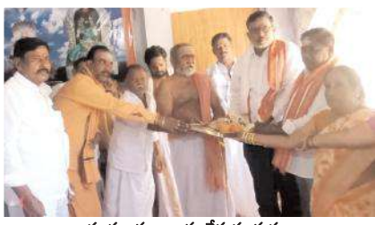
ముహూర్తం ఖరారు చేస్తున్న దృశ్యం