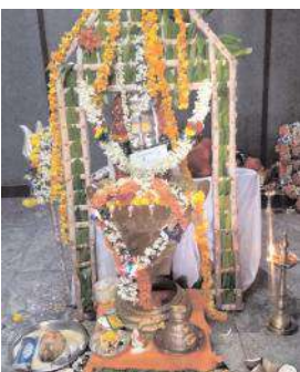
పూజలు అందుకుంటున్న నీలకంఠేశ్వరుడు