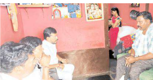
వైకాపా నాయకుడిని పరామర్శించిన నాయకులు