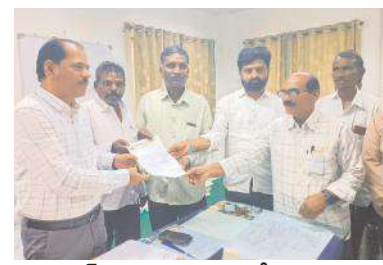
కమిషనర్ కు వినతిపత్రం అందజేస్తున్న దృశ్యం