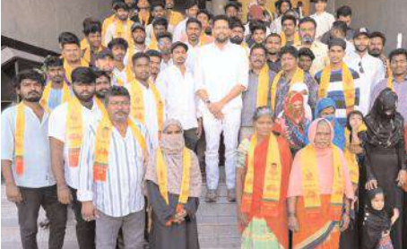
టీడీపీలో చేరిన మహిళలు, యువకులు