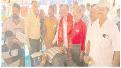
రక్షదాన చేస్తున్న దృశ్యం