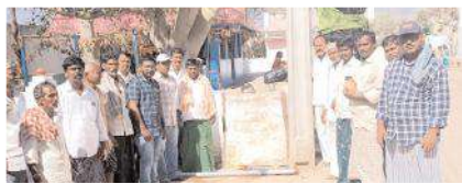
పనులను ప్రారంభిస్తున్న దృశ్యం