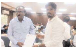
వినుతివ్రతం అందజేస్తున్న దృశ్యం

కర్నూలు రూరల్, మేజర్ న్యూస్: మండలంలోని ఉల్లాల నుంచి రేమట గ్రామానికి చేపట్టిన రోడ్డు నిర్మాణం పెండింగ్ పనులను తక్షణమే పూర్తి చేయాలని రాయలసీమ