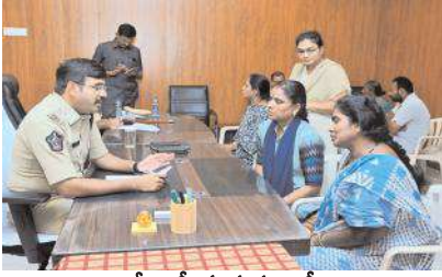
అడ్వీలు స్వీకరిస్తున్న ఎస్పీ

ప్రజల నుంచి ఎస్పీ వినతులు స్వీకరించారు. స్పందన కార్యక్రమానికి 76 ఫిర్యాదులు వచ్చాయి. వాటిలో కొన్ని ఫిర్యాదులు.