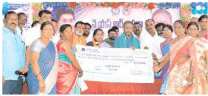
చెక్కు అందజేస్తున్న దృశ్యం

కల్లూరు, మేజర్ న్యూస్: వైఎస్సార్ ఆసరా పథకం మహిళలకు భరోసాను ఇస్తుంది పాణ్యం ఎమ్మెల్యే కాటసాని రాంభూపాల్ రెడ్డి అన్నారు. సోమవారం కల్లూరు ఎంపీడివో కార్యాలయంలో వైఎస్సార్ ఆసరా 4వ విడత సంబరాలను నిర్వహించారు. ఈ సందర్భంగా కాటసాని రాంభూపాల్ రెడ్డి మాట్లాడుతూ సీఎం వైఎస్.జగన్ పేద మహిళల సంక్షేమానికి ఎంతో కృషి చేస్తున్నారు. ప్రభుత్వం అమలు చేస్తున్న ప్రతి పథకంలో మహిళలకు ప్రాధాన్యత ఇస్తున్నారన్నారు. అనంతరం సీఎం జగన్ చిత్రపటానికి పాతాభిషేకం నిర్వహించి కేక్ కట్ చేశారు. మహిళలకు చెక్కు అందజేశారు. ఈ కార్యక్రమంలో మండలంలోని ప్రజాప్రతినిధులు, వైసీపీ నాయకులు, కార్యకర్తలు పాల్గొన్నారు.