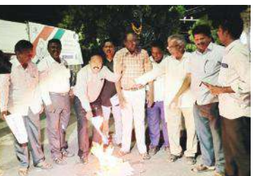
జీవో కాపీలను దగ్ధం చేస్తున్న దృశ్యం