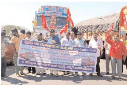
రాస్తాకో నిర్వహిస్తున్న దృశ్యం