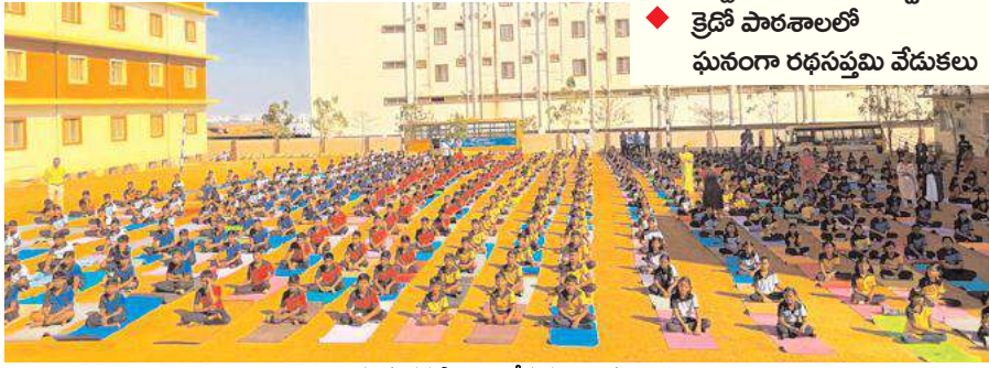
సూర్య నమస్కారాలు చేస్తున్న విద్యార్థులు