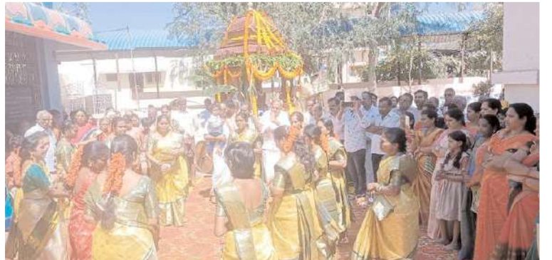
శ్రీవేంకటేశ్వర స్వామి ఆలయంలో రథోత్సవం నిర్వహిస్తున్న దృశ్యం

ఆత్మకూరు, మేజర్ న్యూస్: పట్టణంలో వెలిసిన శ్రీవేంకటేశ్వరస్వామి దేవాలయంలో రథసప్తమి వేడుకలను అత్యంత వైభవంగా నిర్వహించారు. సృష్టిలో జీవరాసులన్ని సుఖిక్షంగా ఉన్నాయంటే సూర్యభగవానుడేనని, హిందూ సాంప్రదాయంలో సూర్యోదయానికి ప్రాముఖ్యత ఉంది. మాఘమాసం, శుక్ల పక్ష సప్తమి తిథినాడు వచ్చే సూర్య జయంతిని అత్యంత భక్తి శ్రద్ధలతో నిర్వహిస్తారు. శుక్రవారం శ్రీ వేంకటేశ్వరస్వామి ఆలయ కమిటీ ఆధ్వర్యంలో రథసప్తమిని పురస్కరించుకొని శ్రీవేంకటేశ్వర స్వామి