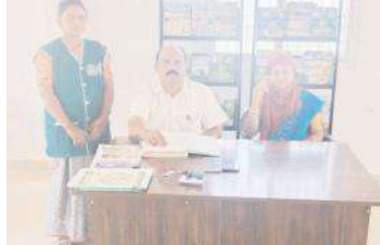
లకార్లును పరిశీలిస్తున్న ఏడీపి మహమ్మద్ ఖాద్రి

గోనెగండ్ల, మేజర్ న్యూస్: రబీలో పంటలను సాగు చేసుకున్న రైతులు ఈనెల 22 లోపు తమ సమీప రైతుభరోసా కేంద్రాలలో ఈకేవైసీని పూర్తి చేసుకోవాలని ఏడీపి మహమ్మద్ ఖాద్రి, ఏవో హేమలత కోరారు. శుక్రవారం మండల పరిధిలోని హెచ్ కైరవాడి గ్రామంలోని ఆర్మీటేలను తనిఖీ చేశారు. రికార్డును పరిశీలించారు. అనంతరం వారు మాట్లాడుతూ సీఎం కిసాన్ ఈకేవైసీ కూడా పూర్తి చేసుకోవాలని కోరారు. రైతులకు ప్రభుత్వం నుంచి వచ్చే సబ్సిడీ ఇతర ప్రధాన అంశాలపై తప్పనిసరిగా ఈకేవైసీ అవసరం అన్నారు. సిబ్బంది స్వామి. అనుష రైతులు పాల్గొన్నారు.