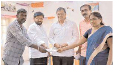
కంటి అద్దాలు పంపిణీ చేస్తున్న దృశ్యం