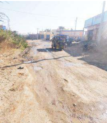
గోనెగండ్ల, గంజహళ్లి ప్రధాన రహదారికి మరమ్మత్తులు చేయండి

గోనెగండ్ల, మరియు గంజహళ్లి మధ్య ఉన్న ప్రధాన రహదారి గుంతమయంగా మారడంతో వాహనాల రాకపోకలకు తీవ్ర ఇబ్బందికరంగా మారిన తక్షణమే నాయకులు, ఆర్ అండ్ బి అధికారులు రహదారికి మరమ్మత్తు చేయాలని గోనెగండ్ల, గంజహళ్లి గ్రామాల ప్రజలు డిమాండ్ చేస్తున్నారు. రోడ్డు సమస్యను పలు మార్లు ఉన్నతాధికారులకు విన్నవించినప్పటికీ ఫలితం కనిపించలేదని గ్రామాల ప్రజలు వాపోతున్నారు. గత కొన్ని మాసాలుగా గుంతలు పడిన రోడ్డు వెంట వాహనాలు వెళ్లేందుకు వాహనదారులు ఇబ్బందులు పడుతున్నారు. దాదాపు ఇప్పటికి ఈ రహదారి పై 20 నుంచి 30 రోడ్డు ప్రమాదాలు జరిగిన సంఘటనలు ఉన్నాయి.