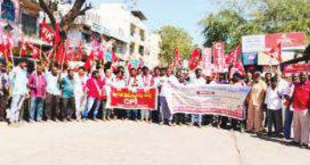
ధర్మా చేస్తున్న దృశ్యం

మోడీ ప్రభుత్వ విధానాలను వ్యతిరేకించండి..