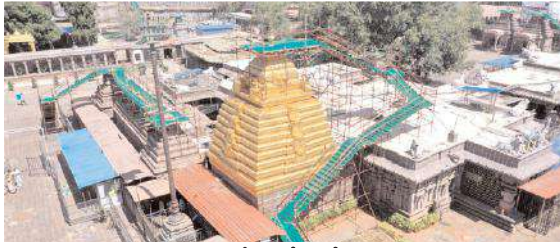
మహాకుంభాభిషేకం కోసం చేసిన ఏర్పాట్లు