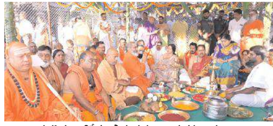
మహా కుంభాభిషేకం ప్రారంభ పూజా కార్యక్రమాల దృశ్యాలు

దేవతాపూజనములు, వేదపూజనములు, జలాధివాసం, వేద స్మృతి, నీరాజనం, మంత్రపుష్పం నిర్వహించారు. మహాకుంభాభిషేకం అంకురార్పణ క్రతువులు జరిపిన అనంతరం శనివారం నుంచి ఈ నెల 20వ వరకు ప్రతిరోజు గోపూజ, మండపపూజలు, వేదపారాయణలు, గణపతి, రుద్ర, చండీ పారాయణలు, హోమములు, వేదపూజనములు, వేదస్మృతి తదితర కార్యక్రమాలు నిర్వహిస్తారు. ఆలయాలలో జరిగే అత్యున్నత కార్యక్రమమే మహాకుంభాభిషేకం. ఈ మహిమాన్విత