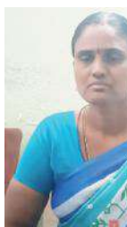
మాట్లాడుతున్న గ్రామ సర్పంచు

హక్కులను దుర్వినియోగం చేస్తుందని ఆవేదన వ్యక్తం చేశారు. రాజ్యాంగం ప్రకారం గ్రామ సర్పంచులకు సర్వ హక్కులున్న గ్రామ పంచాయతీ తీర్మానం లేకుండా ఏ పని మొదలు పెట్టుకోకూడదని రాజ్యాంగంలో పొందు పరిచిన ప్రభుత్వ అధికారులు అధికార పార్టీ నాయకుల అండదండలు మెండుగా ఉన్నాయి. జాతీయ గ్రామీణ ఉపాధి హామీ పథకంలో ఏ చిన్న పని మొదలు పెట్టిన సర్పంచుల తీర్మానం అవసరం. అయితే మా గ్రామ పంచాయతీలో తీర్మానం లేకుండా క్షేత్ర స్థాయికుడిని ఏలా ఎంపిక చేస్తారని అధికారులను నిలదేశారు. గ్రామ సర్పంచులు తీర్మానానికి మాత్రమే పరిమితమా... ఫీల్డ్ అసిస్టెంట్లను ఎంపిక చేయడంలో పంచాయతీ తీర్మానం అవసరం లేదా అని వాపోయారు. ఇప్పటికైనా జిల్లా అధికారులు స్పందించి అక్రమ మార్గంలో ఎంపికైన ఫీల్డ్ అసిస్టెంట్లను తొలగించాలని వారు కోరారు.