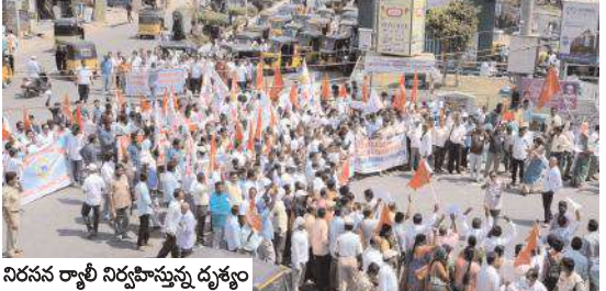
నిరసన ర్యాలీ నిర్వహిస్తున్న దృశ్యం