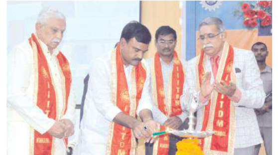
జ్యోతి ప్రజలన చేస్తూ, రాష్ట్ర ఉప ముఖ్యమంత్రి

ఎక్కాంటు చేశామని తెలిపారు. ఇలాంటి టెక్నాలజీ సంబంధించిన ఇన్ఫిట్యూషన్ వలన భారతదేశం ఎంతో అభివృద్ధి చెందుతూ వందే భారత్ లాంటి రైలును సొంత