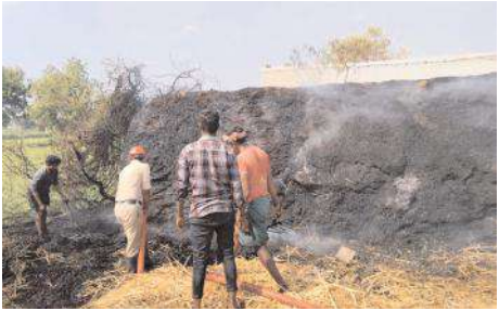
గడ్డివాములను ఆర్పుతున్న దృశ్యం

పెద్దకడుబూరు, మేజర్ న్యూస్ : పెద్దకడుబూరు మండల పరిధి లోని హెచ్. మురువణి గ్రామానికి సమీపంలో ఉన్న దస్తగిరి తాతదర్గా వద్ద మూడు గడ్డివాములకు మంగళవారం గుర్తు తెలియని దుండగులు నిప్పు పెట్టడంతో అవిపూర్తిగా కాలిపోయి దాదాపు రూ.1.50 లక్షల వరకు ఆస్తి నష్టం జరిగిందని బాధితులు బోయ