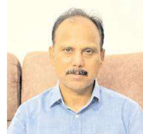
గత కమిషనర్ రవిచంద్రారెడ్డి

ముఖ్య అధికారి ఒకరికి పరిచయం చేశారు. అదే కాంట్రాక్టర్ ను మరో ద్వితీయ శ్రేణి నాయకులు ఒకరు ప్రాధాన్యత ఇవ్వవద్దని అదే ముఖ్య అధికారికి చెప్పారు. అప్పటికే నిధుల వినియోగం అంశం జోరుగా సాగుతూ వచ్చింది. రెండవసారి చెప్పిన ద్వితీయ శ్రేణి నాయకుడి మాట చెల్లుబాటు కానట్లు తెలుస్తోంది. ప్రభుత్వం జగన్ ను సురక్ష క్రింద విద్యార్థులకు, ప్రజలకు అత్యవసరంగా సర్టిఫికేట్లను అందించే ప్రక్రియకు శ్రీకారం చుట్టింది. ఇందుకు ప్రభుత్వం ప్రతి సచివాలయానికి రూ. 12500 నిధులను విడుదల చేసింది. నంద్యాల మున్సిపాలిటీలో 42 సచివాలయాలు ఉన్నాయి. ప్రభుత్వం నుంచి సుమారు రూ. 6 లక్షల నిధులు విడుదలయితే జగన్ ను సురక్ష కార్యక్రమాలను చేపట్టిన కాంట్రాక్టర్ కు రూ. 14 లక్షల చెల్లింపులు జరిగింది. మున్సిపల్ జనరల్ ఫండ్ నుంచి ప్రభుత్వం విడుదల చేసిన నిధులను మినహాయించి మిగిలిన మొత్తాన్ని కాంట్రాక్టర్ కు చెల్లించారు. జగన్ ను ఆరోగ్య సురక్ష పథకం క్రింద ప్రతి అర్బన్ హెల్త్ సెంటర్ కు