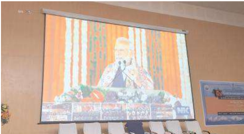
వర్చువల్ గా కర్నూలు ట్రిపుల్ ఐటీ డీ ఎం ను ప్రారంభిస్తున్న ప్రధాని మోదీ