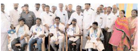
సేవారత్న పొందిన వాలంటరీలతో అధికారులు, నాయకులు

దేవనకొండ మేజర్ న్యూస్ : గ్రామాలలోని ప్రజలకు అందుబాటులో ఉంటూ వారి ఇంటి దగ్గరికే ఉత్తమ సేవలందించిన వాలంటరీలకు ప్రభుత్వం ఉత్తమ పురస్కారాలను ప్రకటించడం జరిగింది. ఈ