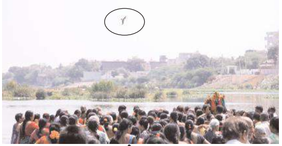
ప్రదక్షిణ చేస్తున్న గరుడ పక్షి

కర్నూలు సోన్స్, మేజర్ న్యూస్ : కర్నూలు నగరంలోని సంకట్ భాగంలో వెలసిన శ్రీదేవి భూదేవి సమేత శ్రీ వెంకటేశ్వర స్వామి ఆలయ 18వ వార్షిక బ్రహ్మాత్మవాలు స్వామి వారి చక్రస్నానంతో వైభవంగా ముగిశాయి. ఈ నెల 10వ తేదీన శ్రీదేవి భూదేవి సమేత శ్రీ వెంకటేశ్వరస్వామి ఆలయ బ్రహ్మాత్మవాలు రాజ్యసభ సభ్యులు టీజీ వెంకటేశ్ ధ్వజారోహణ చేసి ప్రారంభించారు. ఐదిరోజుల విశేష పూజా కార్యక్రమాల అనంతరం మంగళవారం స్వామి వారి వార్షిక బ్రహ్మాత్మవాల చక్రస్నానం కార్యక్రమంలో వైభవంగా ముగించారు. వేడుకల్లో రాజ్యసభ మాజీ సభ్యులు టీజీ వెంకటేశ్ పాల్గొన్నారు. ఈ సందర్భంగా జరిగిన పూజా కార్యక్రమాల్లో నగరంలోని వివిధ ప్రాంతాల నుంచి ప్రజలు అధిక సంఖ్యలో హాజరయ్యారు. స్వామి వారికి ప్రత్యేక పూజా కార్యక్రమాల