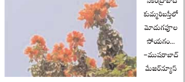
సికింద్రాబాద్ కుమ్మరిబస్టిలో మోదుగపూల సోయగం... -ముషీరాబాద్ మేజర్ న్యూస్