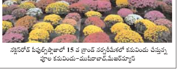
నల్లపేట పీపుల్స్ ఫ్లవర్ షో 15 వ గ్రాండ్ సర్వీమేళలో కనువిందు చేస్తున్న పూల కనువిందు -ముషీరాబాద్,మేజర్ న్యూస్