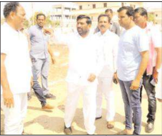
నల్లగొండ జిల్లా బ్యూరో

కాంగ్రెస్ నేతల అవివేకంతోనే కృష్ణా పై హక్కుని కోల్పోయాం