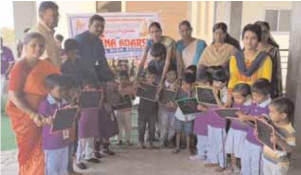
చిన్నారులతో అక్షరభ్యాసం చేయిస్తున్న ఉపాధ్యాయులు