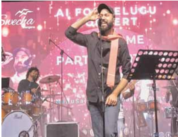
కథలు డేటాబేస్లో ఎనిమిది వేల మందిని నిమగ్నం చేసింది. జనవరి 6, 2024న బాహుబలి సినిమా నిర్మాత శోభు యార్లగడ్డ మా స్వేచ్ఛ ఏబి చందమామ కథల భాషా సమూహాను ప్రారంభించారు.