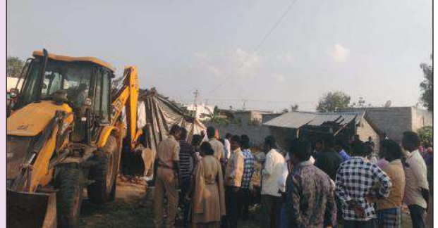
ఆక్రమణలను తొలగింపజేశారు. ప్రభుత్వ స్థలాలను ఆక్రమిస్తే చర్యలు తీసుకుంటున్నారు.