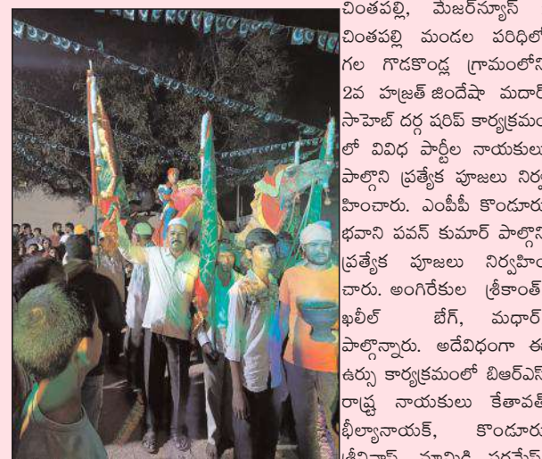
బిఆర్ఎస్ నాయకులు తదితరులు ఉన్నారు.