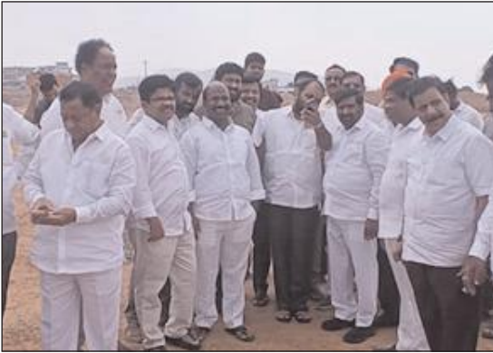
నల్లగొండ జిల్లా బ్యూరో