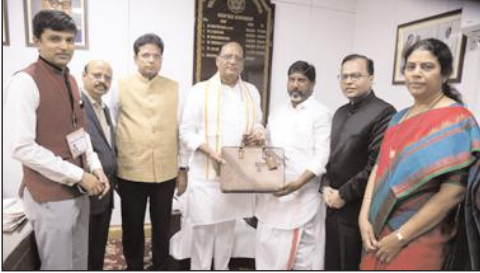
నల్లగొండ జిల్లా బ్యూరో