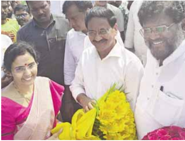
నెల్లూరు, మేజర్ న్యూస్: నిజం గెలవాలి కార్యక్రమంలో భాగంగా ఉదయగిరి నియోజకవర్గం కొండాపురం మండలం, కొమ్మి గ్రామానికి విచ్చేసిన నారా