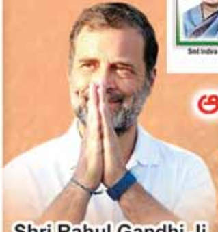
Shri Rahul Gandhi Ji