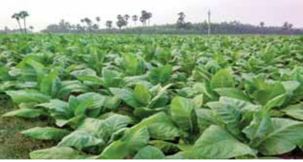
పొదిలి లతోపాటు ఉత్తరాదిలోని ఐదు కేంద్రాల్లోనూ వేలం ప్రారంభించనున్నారు. ఈ ఏడాది పొగాకు సాగులో ఖర్చులు భారీగా పెరిగిన విషయాన్ని సమావేశంలో పలువురు రైతు ప్రతినిధులు బోర్డు అధికారులు వ్యాపారుల దృష్టికి తీసుకెళ్లారు. వాస్తవ ఉత్పత్తి ఖర్చులను పరిగణిస్తే తీసుకొని ఆరంభం నుంచే సరైన ధరలు లభించేలా చర్యలు తీసుకోవాలని కోరారు. అందుకోసం ప్రారంభ ధర కిలోకు రూ. 250 లు ఇచ్చేలా చూడాలని కోరినట్లు సమాచారం. వేలం ప్రక్రియ ప్రారంభ సమయానికి స్పష్టత వచ్చే అవకాశం ఉంది.