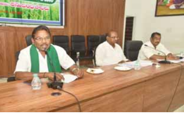
లేకుండా సంతృప్తిగా స్థాయిలో రైతులకు అందజేసినట్లు చెప్పారు. 25600 మెట్రిక్ టన్నుల నాణ్యమైన ఎరువులను రైతులకు అందించామన్నారు. ఇటీవల సంబంధించిన మిచౌంగ్ తుఫాన్ తో పంట్ల సప్లయ్ రైతులకు వెంటనే 80 శాతం సబ్సిడీతో విత్తనాలను సరఫరా చేసి రైతులకు అండగా నిలిచినట్లు చెప్పారు. వ్యవసాయంతో పాటు పశుసంపర్క శాఖలో కూడా విప్లవాత్మక మార్పులకు శ్రీకారం చుట్టి మనుషులతో పాటు పశువులకు కూడా అంబలెన్స్ ఏర్పాటు చేసిన ఘనత దేశ చరిత్రలో ఒక్క ముఖ్యమంత్రి జగన్మోహన్ రెడ్డికే దక్కిందన్నారు. అన్నదాతలందరూ ఈ క్రాప్ బుకింగ్, ఈకెవైసి తప్పనిసరిగా చేసుకోవాలని, ఈ విషయం పై జిల్లాలోని రైతులకు