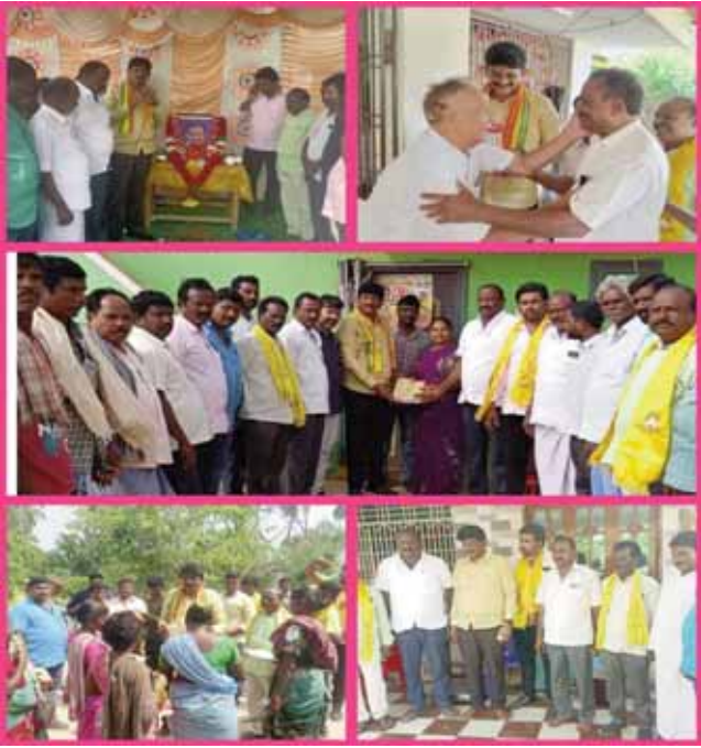
వైకాపా పాలనలో అన్యాయాలు,