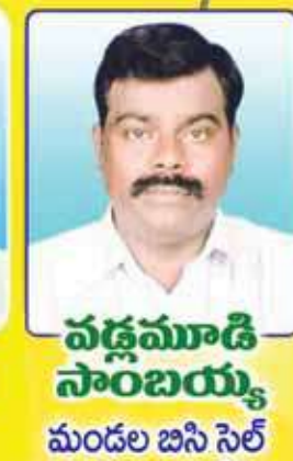
వడ్లమాడి సాంబయ్య మండల జనీ సెల్ అధ్యక్షులు, ఇంకొల్లు

బహిరంగ సభ : తేదీ : 17-02-2024 మధ్యాహ్నం 1.30 గం||లకు పర్చూరు నియోజకవర్గం, ఇంకొల్లు గ్రామంలోని పావులూరి ఆంజనేయస్వామి గుడి రోడ్డులోని తారకరామ విజయభేరి ప్రాంగణం, టి.టి.డి. కళ్యాణమండపం దగ్గర, జరుగును.