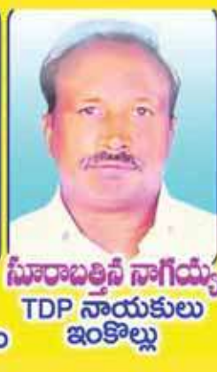
సూరాబత్రిసీ నాగయ్య TDP నాయకులు ఇంకొల్లు