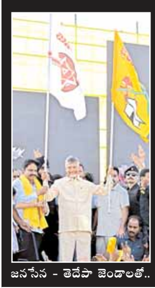
జనసేన - తెదేపా జెండాలతో..