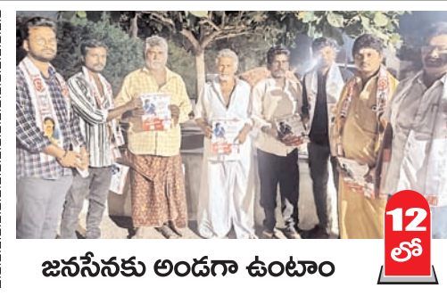
జనసేనకు అండగా ఉంటాం 12 లో