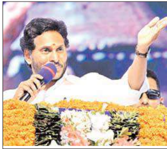
అడుగుగా పడింది. పేదలకు ఒక న్యాయం, పెద్దలకు మరో న్యాయం ఉండటానికి వీల్లేదని, పేదలకిచ్చే ఇళ్ల

ఒంగోలు, మేజర్ న్యూస్: పేద ప్రజల ఆనందమే ధ్యేయంగా ప్రభుత్వం అనేక సంక్షేమ పథకాలు అమలు చేస్తూ ముందుకు పోతోందని రాష్ట్ర ముఖ్య మంత్రి వైఎస్ జగన్మోహన్ రెడ్డి అన్నారు. నవరత్నాలు పేదలందరికీ ఇళ్లు కింద రాష్ట్ర వ్యాప్తంగా ఉచితంగా పంపిణీ చేసిన 31.19 లక్షల ఇళ్ల స్థలాలను ఆ పేద అక్కచెల్లెమ్మల పేరుమీదగానే సంపూర్ణ హక్కులు కల్పిస్తూ, రిజిస్ట్రేషన్ కూడా చేసి కన్వేయన్స్ డిడ్స్ అందించే కార్యక్రమాన్ని ఒంగోలులో ముఖ్యమంత్రి వైఎస్ జగన్మోహన్ రెడ్డి ప్రారంభించారు. అనంతరం జరిగిన సభలో మాట్లాడుతూ రాష్ట్రంలో పేదలకు ఇళ్ల స్థలాల్నిచ్చే కార్యక్రమం జరుగుతుందన్నారు. ఈ 58 నెలల కాలంలో వేసిన ప్రతిఅడుగు ప్రతి అడుగుగా పేదల జీవితాలు మారాలి, వారి బతుకులు మారాలి, పేద పిల్లలు ఎదగాలి, భవిష్యత్లో పేదరికం నుంచి బయటకొచ్చే పరిస్థితి రావాలని ప్రతి