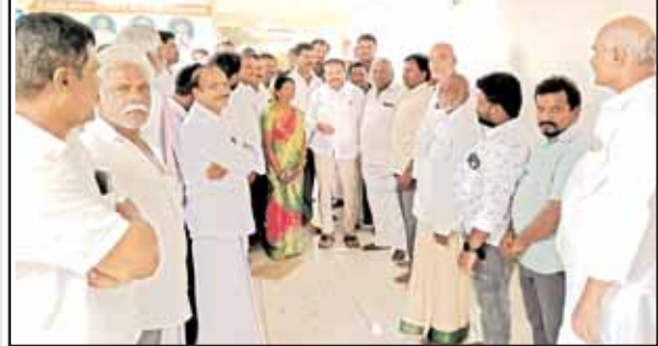
తమ సహాయ సహకారాలు అందిస్తామని అద్దంకిలో వైసిపి గెలుపుకు కృషి చేస్తామని ఈ సందర్భంగా కాలనీవాసులు తెలియజేశారు.