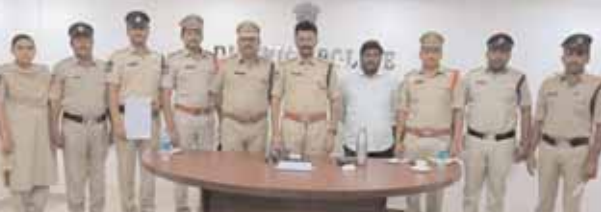
ఆపరేషన్ స్పెల్ ద్వారా 162 మంది బాలకార్మికులను విముక్తి చేసింది.

వికారాబాద్ జిల్లా ప్రతినీధి, మేజర్ న్యూస్ (ఫిబ్రవరి 01): 162 మంది బాల కార్మికులకు విముక్తి లభించినది జిల్లా ఎస్పీ కోటిరెడ్డి తెలిపారు. గురువారం ఆపరేషన్ స్పెల్ - ముగింపు సమావేశం జరిగింది. ఈ సందర్భంగా ఆయన మాట్లాడుతూ.... జనవరి నెల మొదటి రోజు ప్రారంభం అయిన నెల మొత్తం కొనసాగిన నిస్తటితో ముగిసిన ఆపరేషన్ స్పెల్ లో అన్ని శాఖల అధికారులు సమన్వయంతో పని చేసి 162 మంది బాలకార్మికులను కాపాడటం చాలా గొప్ప