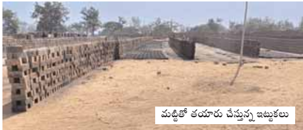
మట్టితో తయారు చేస్తున్న ఇటుకలు

ఇటుక బట్టిని కార్టేందుకు హరితహారం చెట్లను విచ్చలవిడిగా నరికి కాలుస్తున్నారు. ఆ సమయంలో వెలువడే పొగతో వాహనదారులు ఇబ్బందులకు గురవుతున్నారు. వ్యవసాయానికి ఉపయోగించే ఉచిత విద్యుత్తును వాడుకుంటున్నారు.