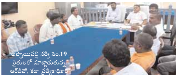
అప్పాయిపల్లి సర్వే నెం.19 రైతులతో మాట్లాడుతున్న ఆర్డీవో, కడా ప్రత్యేకాధికారి