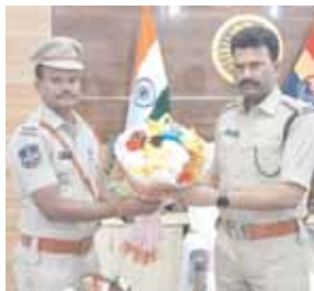
పెద్దేముల్ ఎన్ఐ గిరి.