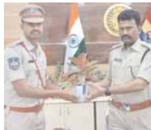
మొమినపేట్ ఎన్ఐ అరవింద్.