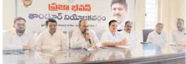
మీడియా సమావేశంలో మాట్లాడుతున్న కాంగ్రెస్ నేతలు.