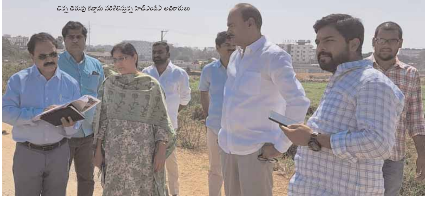
చిన్న చెరువు కట్టాను పరిశీలిస్తున్న హెచ్ఎం డీఏ అధికారులు

రంగారెడ్డి జిల్లా ప్రతినది, మేజర్ న్యూస్ (ఫిబ్రవరి 09) : కళ్లముందే కదలాడే చిన్న చెరువు, విలేజీ మ్యాప్ లోనూ స్పష్టంగా కనిపిస్తున్న ఆనవాళ్లు, ఎన్ని ఆధారులున్నా... కొందరి పెద్దలు, రియల్టర్ల కన్ను పడింది. అంతే ఇరిగేషన్ అధికారులు కళ్లుమూసుకుని నిరంభ్యంతర పత్రాలు జారీ చేసేశారు. తామేమీ తక్కువ తిన్నామా? అంటూ హెచ్ఎం డీఏ కూడా ఇందుకు గ్రీన్ సిగ్నల్ ఇచ్చేసింది. అంతే అక్రమార్కులు ఆ చెరువును శరబట్టారు. ఏకంగా చెరువు శిఖంలో వెంచర్ కు లే అప్పట్ పర్మిషన్ (ఎల్పీ నంబర్) సైతం వచ్చేసింది. కనీసం రోడ్డు కూడా లేని ఈ భూములకు ఎల్పీ నంబర్ ఎలా జారీ చేశారో ఇప్పటికీ అంతు చిక్కడం లేదంటూ కొందరు స్థానికులు ముక్కున వేలేసుకుంటున్నారు. ఇంకేముందు విలువైన ప్రభుత్వ భూమి ప్రైవేటు వ్యక్తులకు దారి చూపించగా, ఈ విషయం తెలియక ఇందులో ప్లాట్లు కొనుగోలు చేసిన వారు వర్షాకాలంలో నిండా మునిగిపోయే దుస్థితి నెలకొన్నది. ప్రజావసరాల కోసం ఉపయోగపడే చెరువులు, కుంటలతో పాటు ప్రభుత్వ భూములను కాపాడాల్సిన రెవెన్యూ యంత్రాంగం విలువైన భూమిని ప్రైవేటు వ్యక్తులకు కట్టబెట్టి స్వామి భక్తిని చాటుకున్నారు.