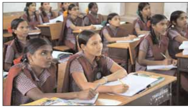
వికారాబాద్ జిల్లా ప్రతినది, మేజర్ న్యూస్ (ఫిబ్రవరి 09) : వికారాబాద్ జిల్లాలో రోజు రోజుకూ విద్యావ్యవస్థ ఆగమవుతుంది. మిగతా 3లో