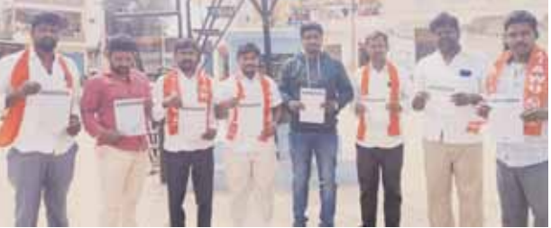
కరపత్రాలను విడుదల చేస్తున్న దృశ్యం.