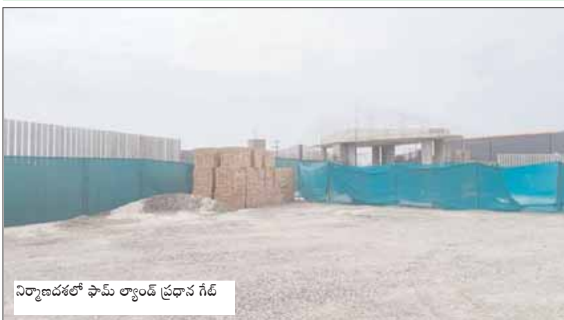
నిర్మాణదశలో ఫామ్ ల్యాండ్ ప్రధాన గేట్

వికారాబాద్ మేజర్ న్యూస్ (ఫిబ్రవరి 22): వికారాబాద్ పరిసర ప్రాంతాలలో వెంచర్లు, ఫామ్ ల్యాండ్లు, విల్లాస్, రీసార్ట్లు పుట్టగొడుగులా వెలుస్తున్నాయి. రోజు రోజుకు ఇక్కడి ప్రాంతంలో ఈ నిర్మాణాలు పదుల సంఖ్యలో పెరిగిపోతున్నాయి. ప్రభుత్వ నియమనిబంధనలు పాటించి