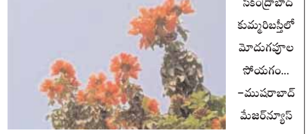
సికింద్రాబాద్ కుమ్మరిబస్టిలో మోదుగపూల సోయగం... -ముషీరాబాద్ మేజర్ న్యూస్