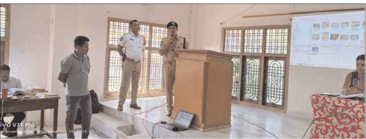
మేడ్చల్, మేజర్ న్యూస్ (ఫిబ్రవరి 4): మేడ్చల్ ట్రాఫిక్ పోలీసులు ఎన్ని ఆంక్షలు పెట్టిన కొంత మంది ద్విచక్రవాహనదారులు బాధ్యతారాహిత్యంగా వ్యవహరిస్తున్నారు. హెల్మెట్ ధరించకుండా రోడ్లపైకి వచ్చేస్తున్నారు. ప్రతి రోజూ ప్రమాదాలు జరుగుతున్నా... పోలీసులు ఎన్ని అవగాహన కార్యక్రమాలు చేపట్టినా.. వాహనదారుల ప్రవర్తనలో మాత్రం మార్పు రావడం లేదు. చివరకు హెల్మెట్ లేదని చలానా రాసినా కట్టడానికి సిద్ధంగా ఉన్నారే తప్ప... కనీసం తమ బాధ్యతగా హెల్మెట్ పెట్టుకుందామనే ఆలోచన లేదు. చేతులు కాలాక అకులు పట్టుకున్నట్లు ప్రమాదం జరిగితే హెల్మెట్ పెట్టుకుంటే ప్రాణాలు దక్కేవే అనే మాటలు మాట్లాడుకోవడం ఇప్పుడు మాములై పోయింది. మిగతా 3లో

• హెల్మెట్ లేని కారణంగా 55 శాతానికిపైగా ప్రమాదాలు • పోలీసులు ఎన్ని అవగాహన కార్యక్రమాలు చేపట్టినా ఫలితం శూన్యం