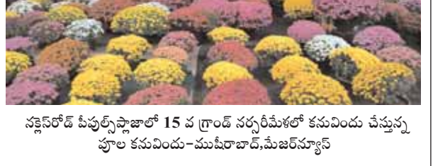
నల్లపేట పీపుల్స్ ఫ్లవర్ షో 15 వ గ్రాండ్ సర్వీసెస్ లో కనువింద చిన్న పూల కనువింద -ముషీరాబాద్,మేజర్ న్యూస్