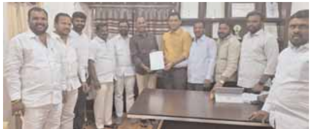
కమిషనర్ కు వినతి పత్రం అందజేస్తున్న దృశ్యం

★ కమిషనర్ ను కోరిన కాంగ్రెస్ కార్యకర్తలు