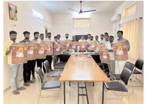
కందుకూరు, మేజర్ న్యూస్ (ఫిబ్రవరి 12): సంత సేవాలాల్ 285 వ జయంతిని