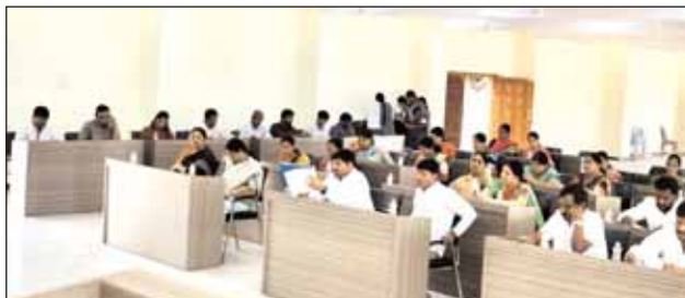
బాలాపూర్ మేజర్ న్యూస్ (ఫిబ్రవరి 13); బడంగ్గేట్ మున్సిపల్ కార్పొరేషన్ లో వార్షిక బడ్జెట్ 82 కోట్ల 78 లక్షలకు ప్రజా ప్రతినిధులు ఏకాభిప్రాయంతో ఆమోదం తెలిపారు. మహేశ్వరం నియోజకవర్గంలోని బడంగ్గేట్ మున్సిపల్ కార్పొరేషన్ కార్యాలయంలో మంగళవారం వార్షిక బడ్జెట్ సమావేశం నిర్వహించారు. మిగతా 2లో