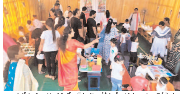
ఆరేప, ఫిబ్రవరి 25 మేజర్ న్యూస్ :జిల్లా కమిషనర్ 10వ వార్డు డైరీపారం, ఆదర్శనగర్ లిటిల్ కిడ్స్ ఫ్లేస్ మార్కెట్ లో ఆదివారం జరిగిన కిడ్స్ ఎక్స్ పో విజ్ఞానం అభివృద్ధికి అనుకూలంగా నిర్వహించారు. ఎల్ కె జి, యు కె జి పిల్లలు నేర్చుకున్న విజ్ఞాన అంశాలను వివిధ సమాచాల రూపంలో ప్రదర్శించడానికి ఈ కార్యక్రమం ఏర్పాటు చేశారు. చిన్నవారు లోని సృజనాత్మక శక్తి, వాక్యీమ వల్ల అమాహున పెరిగి మరింత మరుకుగా ముందుకు వెళ్ళడానికి ఇలాంటి ప్రదర్శనలు ఉపయోగ పడతాయని తల్లిదండ్రులు అభిప్రాయం వ్యక్తం చేశారు. విద్యార్థులు ప్రదర్శించిన ప్రాజెక్టులు, సమాచాల అమాహున ఎంతగానో అలరించాయి.