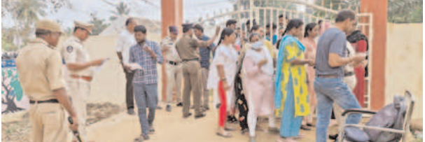
పద్మనాభం,ఫిబ్రవరి25,మేజర్ న్యూస్ : మండలంలో రెడ్డిపల్లి, పద్మనాభం గ్రామాలలో ఆదివారం జిల్లా ఉన్నత అధికారులు ఏర్పాటు చేసిన గ్రూప్ 2 పరీక్షలు గట్టి పోలిసుబంధోబస్సు మధ్య ప్రశాంతంగా జరిగాయి. అయితే ఉదయం తొమ్మిది గంటలకే అభ్యర్థులు పరీక్షా కేంద్రాలకు చేరుకున్నారు. అయితే రెడ్డిపల్లి గ్రామ జిల్లా పరిషత్ ఉన్నత పాఠశాలలో ఏర్పాటు చేసిన ఈ గ్రూప్ 2 పరీక్షా కేంద్రానికి కేటాయించిన 240మందికి 188 మంది అభ్యర్థులు హాజరుకాగా, పద్మనాభం గోస్వమి విద్యాపీఠ కేంద్రంలో 216 మందికి 160 మంది హాజరైనట్లు అధికారులు తెలిపారు. పరీక్షలు రాసే అభ్యర్థులు కాఫీపైన రావడంతో అందరినీ అత్యంత గౌరవంతో గుర్తించారు.