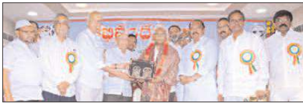
సేవాధ్యక్షులం, నిబద్ధతే విజయరహస్యాలు: చలసాని