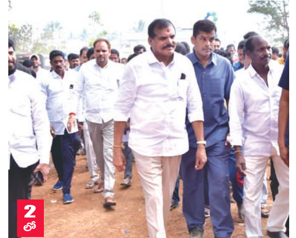
విశాఖపట్నం, ఫిబ్రవరి 10, మేజర్ న్యూస్: వినియోగదారులకు మెరుగైన సేవల కోసం నిరంతర విద్యుత్ సు సరఫరా చేస్తున్న ఆంధ్రప్రదేశ్ తూర్పు ప్రాంత విద్యుత్ పంపిణీ సంస్థ(పిసిపి) సచివాలయ భవనం ప్రారంభం అవ్వాలని ఆయన కోరారు. ఇండిపెండెంట్ పవర్ ట్రాన్జిమిషన్

ప్రజల బాగు కోరే ప్రభుత్వాన్ని ఎన్నుకోండి - రాష్ట్ర విద్యాశాఖ మంత్రి బొత్త సత్యనారాయణ రావివలసలో సచివాలయ భవనం ప్రారంభం