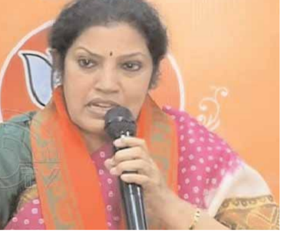
మద్దతు ఉండడంతో ఆమె పునరాలోచనలో పడినట్లు చెబుతున్నారు. పొత్తు ఉంటే విశాఖ ఎన్నికల్లో పార్లమెంట్ స్థానం నుంచి బరిలో పోటీ చేసేందుకు తుది పర్యంతం చేయడమేనని చెబుతున్నారు. ఇందుకు కేంద్ర అధికారులకత్తం కూడా గ్రీన్ సిగ్నల్ ఇచ్చినట్లు పార్టీ విశ్వాసం అయిన బరిలో ఉంటారు. పార్టీ లేకపోయినా పోటీ చేసేందుకు ఆయన సన్నాహాలు చేసుకుంటున్నారు. పురందేశ్వరికి ప్రత్యామ్నాయ సీటు! టీడీపీ, జనసేనతో పొత్తు ఉంటే బీజేపీ నుంచి విశాఖ పార్లమెంట్ స్థానం నుంచి బరిలో దిగాలని మాజీ కేంద్ర మంత్రి, బీజేపీ రాష్ట్ర అధ్యక్షురాలు పురందేశ్వరి భావించారు. కానీ, జీవీఎల్ ఇక్కడ ముందుగానే కర్ఫీవే వేయడం, దానికి అధికారులకత్తం నుంచి కూడా కొంత వరకు

విశాఖపట్నం.. విశాఖపట్నం ఎంపీ స్థానం నుంచి బరిలోకి దిగేందుకు భారతీయ జనతా పార్టీ రాజ్యసభ సభ్యుడు జీవీఎల్ నరసింహారావు జోరుగా ఏర్పాట్లు చేసుకుంటున్నారు. టీడీపీ, జనసేన, బీజేపీ పొత్తులో భాగంగా పోటీ చేసినా, ఒంటిగా పోటీ చేసినా ఇక్కడి నుంచి బరిలో దిగేందుకు ఆయన సన్నాహాలు చేసుకుంటున్నారు. గడిచిన నాలుగేళ్ల నుంచి విశాఖ వేదికగానే ఆయన రాజకీయ కార్యక్రమాలు నిర్వహిస్తున్నారు. ఈ విధాని సంక్రాంతి సందరాల్చు పేరుతో భారీ ఎత్తున పండగను నిర్వహించారు. గణపత్రం దినోత్సవ వేడుకలను టీఎస్ రోడ్డులో జీవీఎల్ అధ్యక్షులతో రెండోరోజుల పాటు ఉత్సాహ భరిత వాతావరణంలో నిర్వహించారు. ఇవన్నీ నిర్వహించడం వెనక వచ్చే ఎన్నికల్లో పార్లమెంట్ స్థానానికి జీవీఎల్ పోటీ చేయడమేనని చెబుతున్నారు. ఇందుకు కేంద్ర అధికారులకత్తం కూడా గ్రీన్ సిగ్నల్ ఇచ్చినట్లు పార్టీ విశ్వాసం అయిన బరిలో ఉంటారు. పార్టీ లేకపోయినా పోటీ చేసేందుకు ఆయన సన్నాహాలు చేసుకుంటున్నారు. పురందేశ్వరికి ప్రత్యామ్నాయ సీటు! టీడీపీ, జనసేనతో పొత్తు ఉంటే బీజేపీ నుంచి విశాఖ పార్లమెంట్ స్థానం నుంచి బరిలో దిగాలని మాజీ కేంద్ర మంత్రి, బీజేపీ రాష్ట్ర అధ్యక్షురాలు పురందేశ్వరి భావించారు. కానీ, జీవీఎల్ ఇక్కడ ముందుగానే కర్ఫీవే వేయడం, దానికి అధికారులకత్తం నుంచి కూడా కొంత వరకు