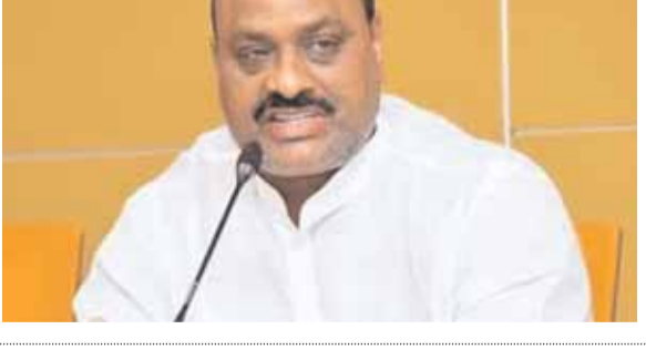
పురందేశ్వరికి ప్రత్యామ్నాయ సీటు!

పురందేశ్వరికి ప్రత్యామ్నాయ సీటు! టీడీపీ, జనసేనతో పొత్తు ఉంటే బీజేపీ నుంచి విశాఖ పార్లమెంట్ స్థానం నుంచి బరిలో దిగాలని మాజీ కేంద్ర మంత్రి, బీజేపీ రాష్ట్ర అధ్యక్షురాలు పురందేశ్వరి భావించారు. కానీ, జీవీఎల్ ఇక్కడ ముందుగానే కర్ఫీవే వేయడం, దానికి అధికారులకత్తం నుంచి కూడా కొంత వరకు