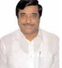
అధిష్టానం కీలక పావులు

రాజమండ్రి : ఎన్నికల సమయం దగ్గరపడుతున్న కొద్దీ రాష్ట్రంలో రాజకీయం రంజంగా మారుతోంది. రోజుకొక కొత్తపేరు తెరకెక్కి వస్తుండటంతో సామాన్య కార్యకర్తలతోపాటు కాకలు తీరని నేతలు సైతం తలలు పట్టుకుంటున్నారు. నిన్నటి వరకు సీటుపై ఉన్న గాయం డి.వి.ఎ. అంటే ఉండటం లేదు. అన్న సీటు వచ్చి గెలిస్తే ఆడుకుంటాడని వెనక తిరిగి జెట్టిలు కొట్టిన అనుచరణానికి ఏమీ అతుబట్టడం లేదు. పొత్తులు, ఎత్తులు, కుల సమీకరణాలు బేరీజు వేసుకునిగానీ.. ప్రధాన పార్టీలు సీట్లు కన్నర్స్ చేయడం లేదు. ముఖ్యమైన సీట్లు, పార్టీకి పట్టుకున్న ప్రాంతాల్లో కాస్త పెట్టుబడి పెట్టగలిగిన వారి కోసమే అన్నీ పుట్టిస్తాయి. విశాఖ నుంచి విజయవాడకు మద్దతులో ఎంతో కీలకమైన రాజమండ్రి కంభంపాటి లోక్ సభ సీటుపై ప్రత్యేకంగా దృష్టిపెట్టారని చెబుతారు. తెలుగు దేశం పార్టీకి కంచుకోట అయిన ఈ స్థానాన్ని మరోసారి తమ ఖాతాలో వేసుకునేందుకు అధిష్టానం కీలక పావులు కదుపుతోంది. గతంలో ఇక్కడి నుంచి విజయం సాధించిన పార్టీ సీనియర్ నేత మురళీమోహన్ కుటుంబం ఈసారి ఎన్నికలకు దూరంగా ఉండాలని నిర్ణయించుకుంది. ఆయన కోడలు రాంపై సైతం ఆసక్తి చూపకపోవడంతో తెలుగుదేశం కొత్త అభ్యర్థిని రంగంలోకి దింపింది.