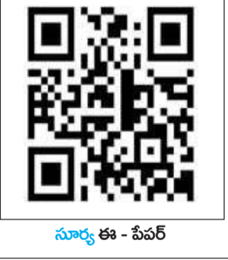
సూర్య ఈ - పేపర్